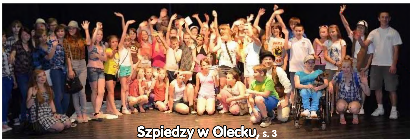
Szpiedzy w Olecku, s. 3