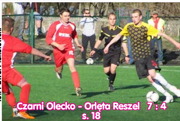
Czarni Olecko - Orleża Reszel 7 : 4 s. 18