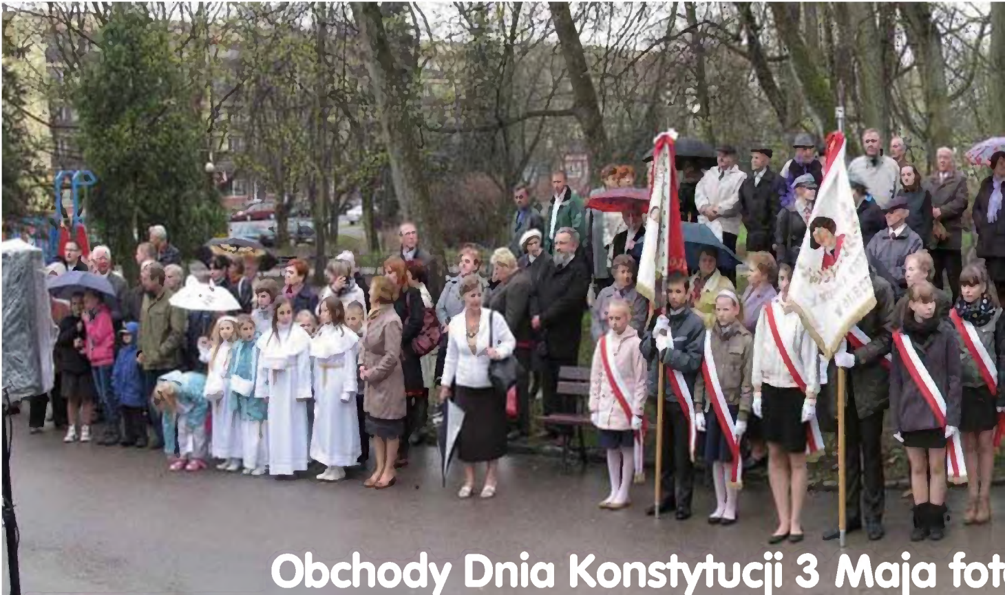
Obchody Dnia Konstytucji 3 Maja foto