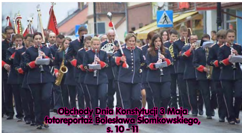
Obchody Dnia Konstytucji 3 Maja fotoreportaż Bolesława Słomkowskiego, s. 10 - 11

Jubileuszowy 20. Przystanek Olecko coraz bliżej! s. 4