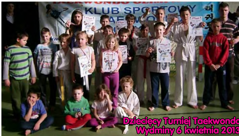
Dzieci Turniej Taekwondo Wydminy 6 kwietnia 2013