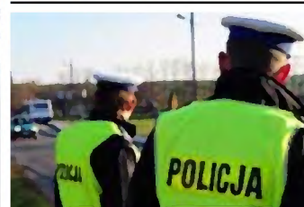
Policyjne podsumowanie majowego weekendu, s. 7

Jubileuszowy 20. Przystanek Olecko coraz bliżej! s. 4