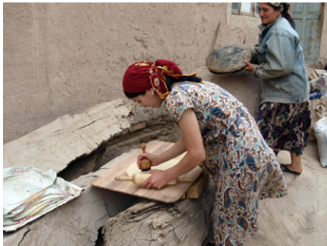
Uzbekistan. Tradycyjny wypiek chleba