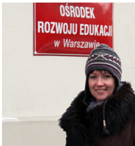
Przed Ośrodkiem Rozwoju Edukacji w Warszawie

B.M.B.: Dziękuję za rozmowę i życzę powodzenia w realizacji wszystkich zamierzeń.