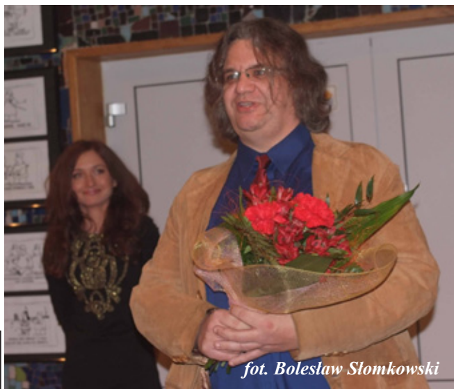
fot. Bolesław Słomkowski