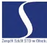
Zespół Szkół STO w Olecku