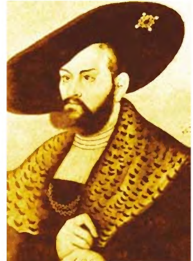
Lucas Cranach, portret Albrechta Hohenzollern von Ansbach