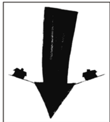
STOWARZYSZENIE KULTURALNE z siedzibą w Olecku