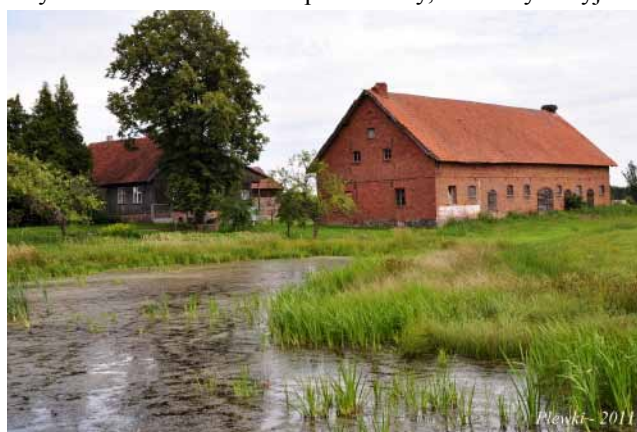
Plewki - 2011

przebiły się głęboko na tereny Prus Wschodnich i znalazły się w zachodniej części Prus. Ich celem był Elbląg, jednakże wtedy o tym nie wiedzieliśmy.