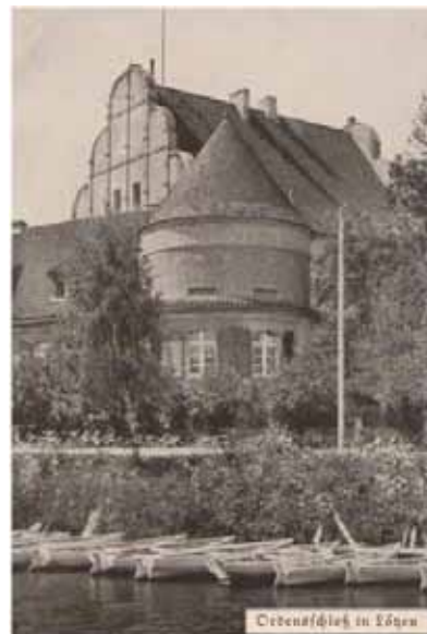
Средняя школа в Укта

Całkiem niespodziewanie, około 25 stycznia, musieliśmy uciekać. Front został przełamany, oddziały rosyjskie