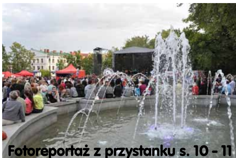
Fotoreportaż z przystanku s. 10 - 11