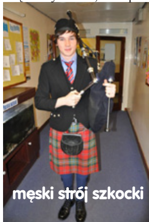
męski strój szkocki

Po oficjalnym przywitaniu wszyscy udali się na zwiedzanie szkoły. Uwagę przykuła szczególnie pracownia plastyczna – zdecydowanie większa, przestronniejsza niż pozostałe klasy. Oprócz potrzebnych materiałów: różnego rodzaju farb, pędzli, płócien, sztalug i innych, znajdowały się tu przyciągające wzrok i budzące podziw prace uczniowskie – wyeksponowane w każdym możliwym miejscu, łącznie z sufitem. Przechodząc korytarzem, nie sposób było nie zauważyć oryginalnej,