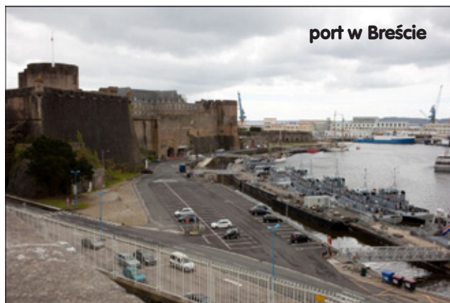
port w Breście