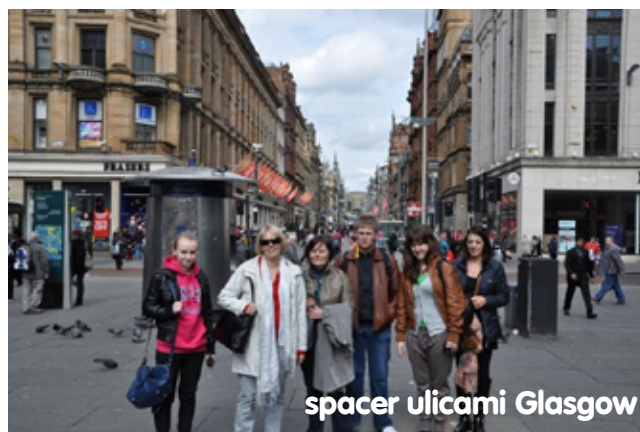
spacer ulicami Glasgow

Kolejne dni przyniosły wycieczki do Edynburga, Ayrshire i Glasgow. W stolicy Szkocji