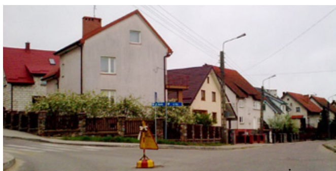
W Olecku mamy nowe rondo. Powstało na ulicy Żeromskiego i czynne jest już od trzech tygodni.