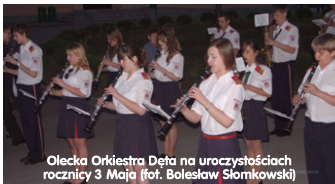
Olecka Orkiestra Dęta na uroczystościach rocznicy 3 Maja