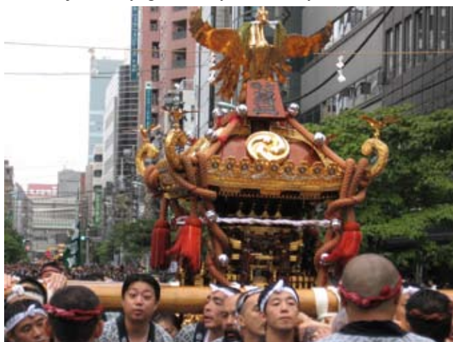
Matsuri. Kaplica mikoshi

Po wypiciu kawy pojechałem metrem do centrum Tokio (Tokyo Station). Bilet 150 jenów. Tutaj poszedłem nad rzekę Sumidagawa. Zrobiłem całkiem spore kółko, chodząc przez mosty. Nad brzegiem mnóstwo drzew wiśni – symbolu szczęścia i przemijania zarazem. I co najważniejsze – przez przypadek uczestniczyłem w Matsuri – wspaniałym japońskim święcie. Nie miałem pojęcia, że taka niespodzianka spotka mnie w stolicy kraju. To festyn i jednocześnie ceremonia religijna. Jego celem jest zapewnienie przychylności bogów – kami. Istotą – rytualne oczyszczenie (wodą – ludzie lali z wiader, pompami, węzami, z hydrantów; tak jak u nas na śmigus-dyngus, tylko tutaj na poważnie); złożenie ofiary; procesja, podczas której kami jest przywoływany do kaplicy i odprowadzany w przenośnej kaplicy – mikoshi (zdobiona i niesiona przez kobiety i mężczyzn niczym lektyka) do tymczasowej siedziby, gdzie odbywa się festyn.