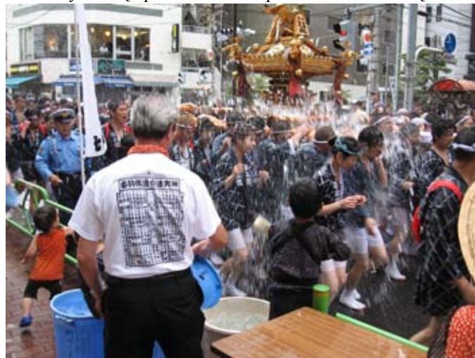
Matsuri. Oczyszczenie - oblewanie wodą

Kiedy zaczął padać deszcz poszedłem w stronę dwor-