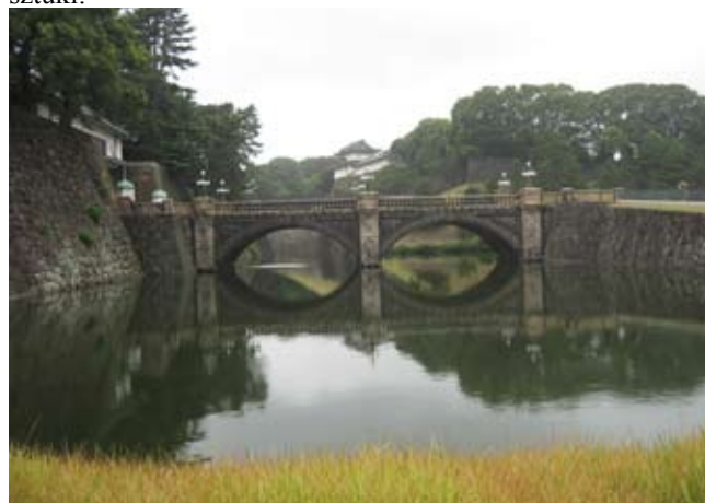
Pałac Cesarski, most Nijubashi

Przekazywane z ojca na syna drzewa stają się dziełami sztuki.