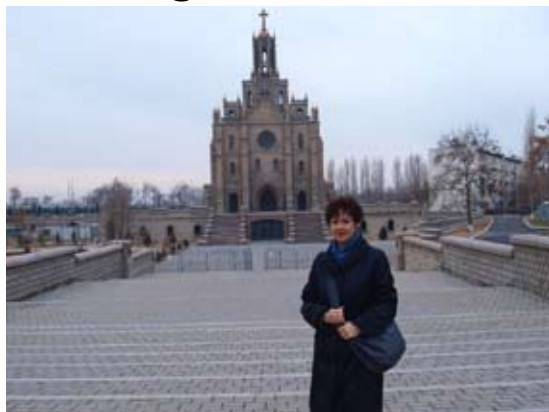
autorka artykułu - w tle Kościół

Jak w przeszłości, tak i teraz kościół jest nie tylko miejscem modlitwy i