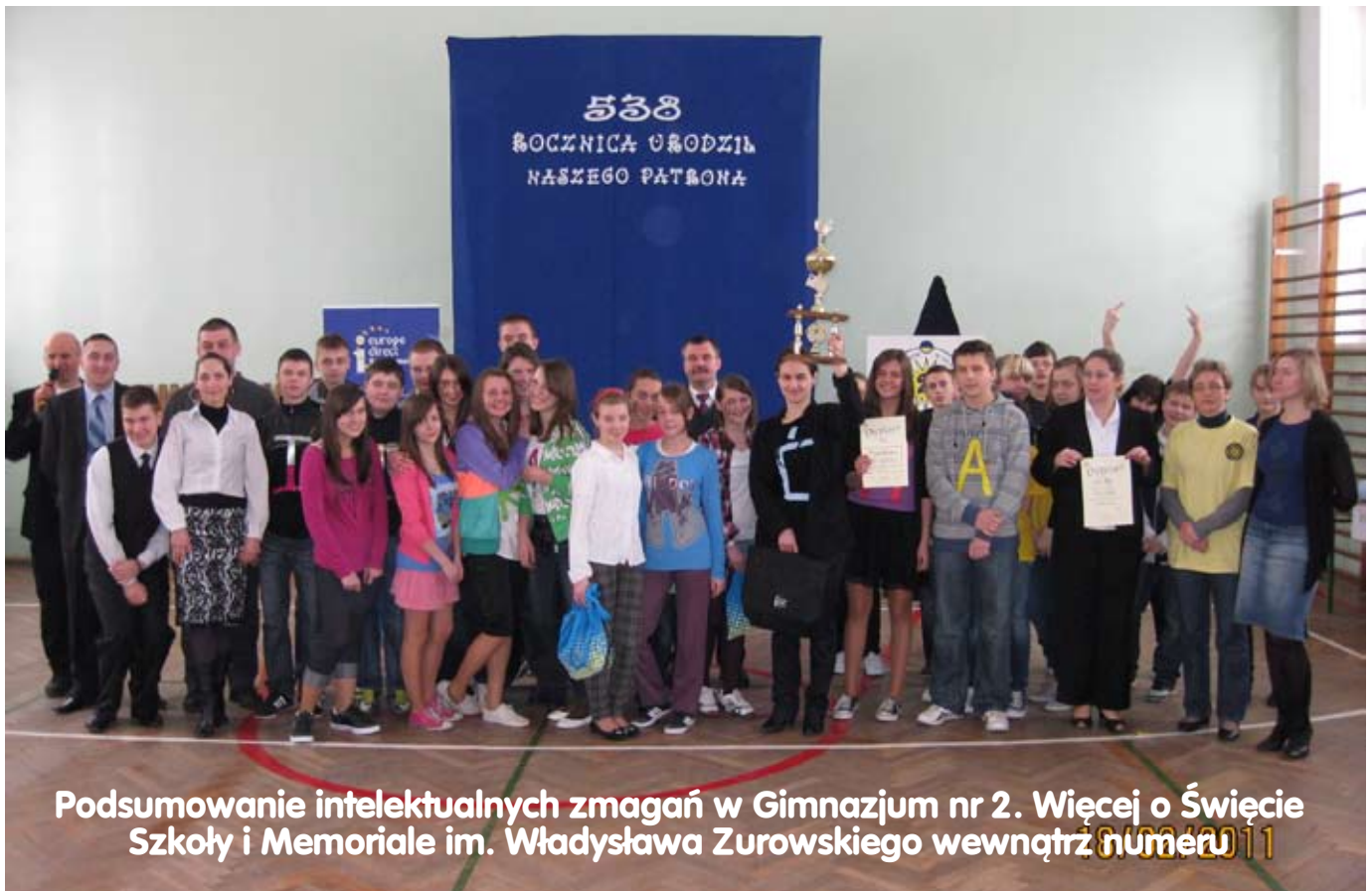
Podsumowanie intelektualnych zmagania w Gimnazjum nr 2. Więcej o Świącie Szkoły i Memoriale im. Władysława Zurowskiego wewnątrz numeru 8/02/2011