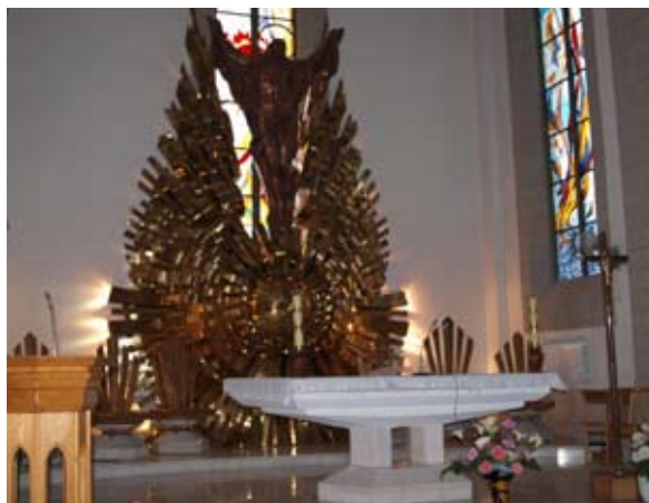
Ołtarz główny, projekt i wykonanie German Adamow