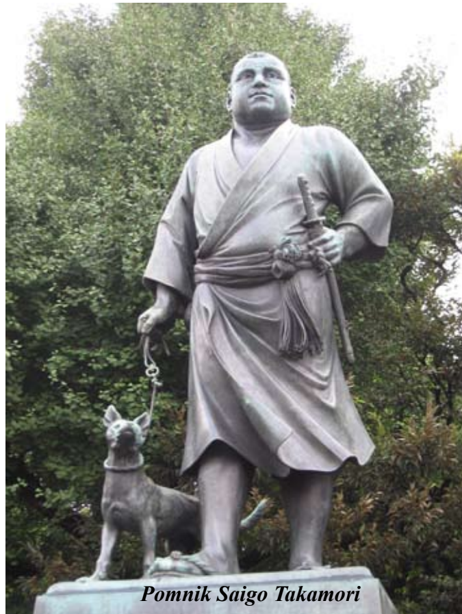
Pomnik Saigo Takamori

zorze w pokoju i oglądać dwa kanały pornograficzne. Karta jest ważna 8 godzin. Koszmar.