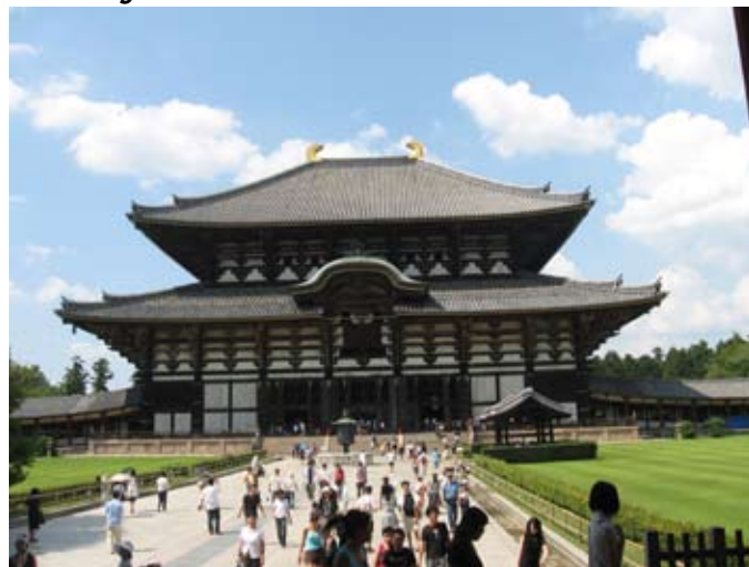
Today. Pawilon Wielkiego Buddy

Dziedzictwa Kulturowego i Przyrodniczego UNESCO.