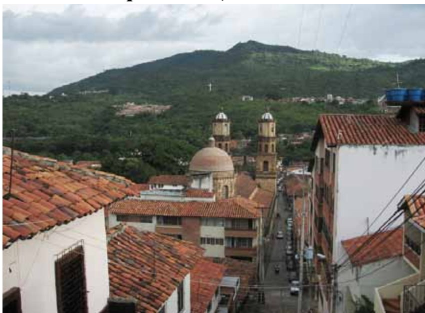
San Gil i XVIII-wieczna katedra

ale roślinność i rzeka uspokajają. Liany, papugi, pracownicy w strojach ludowych; pomiędzy drzewami fantastycznie sączy się światło, a górskie potoki przecinają alejki. Później pojechaliśmy 30 km za miasto nad