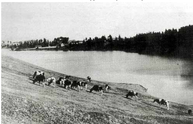
Nad Jeziorem Sedranckim. Zdjęcie z książki „Treuburg...”

Józef Kunicki (zdjęcia i reprodukcje autora)