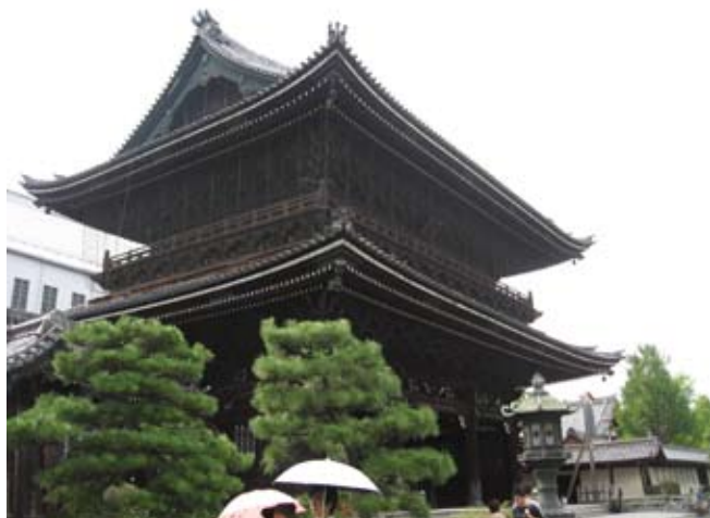
Dwupiętrowa brama świątyni Higashi-Honganji

Po 9. wyszliśmy z miłego hoteliku. Kupiliśmy w automacie bilety do Kioto (po 890 jenów). Jechaliśmy 45 minut. Dworzec kolejowy ładny i bardzo duży, ale miasto takie sobie. Nie mogliśmy znaleźć naszego hotelu Iida, chociaż znajdował się niedaleko dworca. Pomogli przechodnie – sympatyczne małżeństwo. Pan w recepcji to typowy służbista.