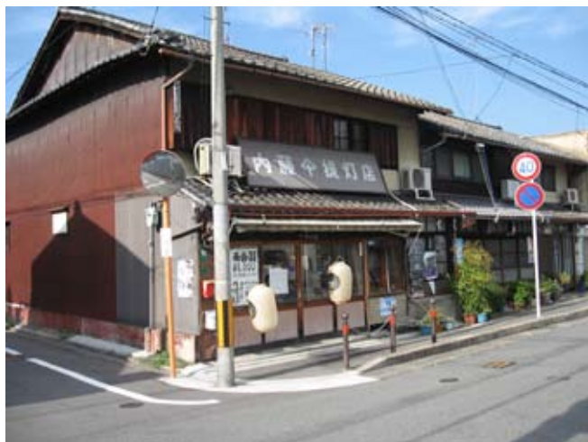
Stara zabudowa Kioto