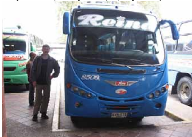
Autobus relacji Bogota - San Gil

Wstaliśmy o godzinie 7. Oczywiście Jacek wcześniej przez całą godzinę medytował (jest buddystą). Zapłaciliśmy za nocle-