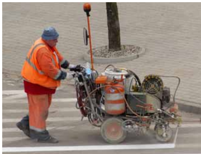
Bolesław Słomkowski - malowanie linii poziomych