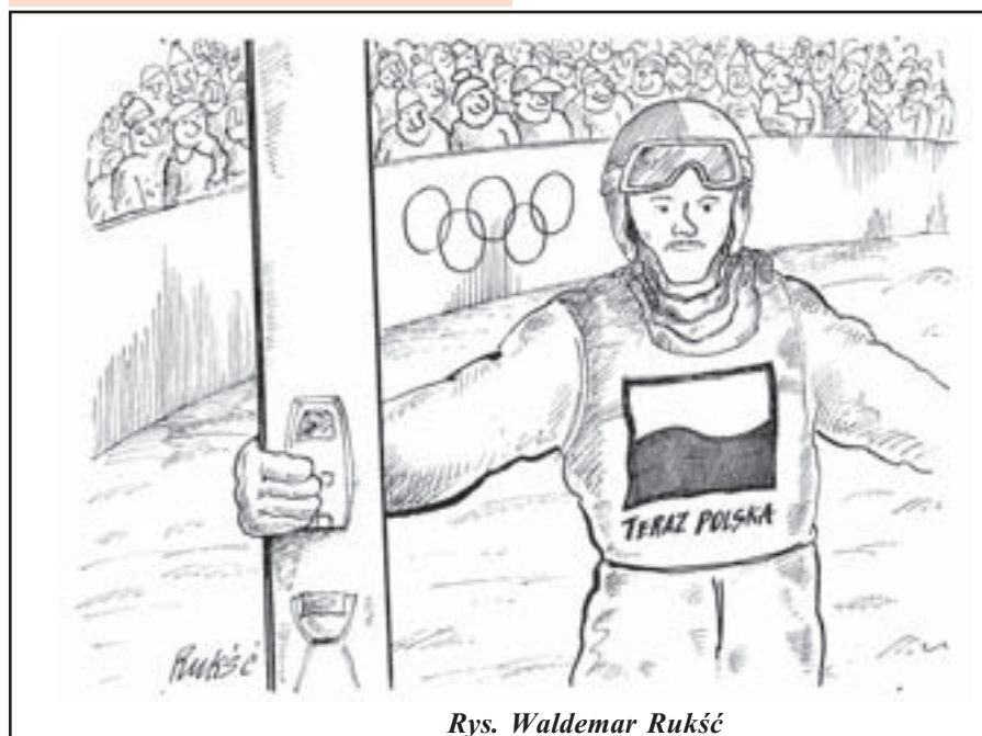
Rys. Waldemar Rukść