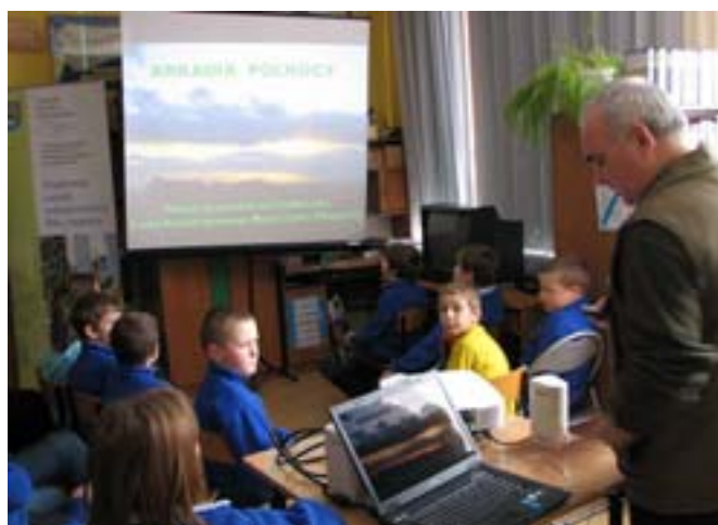
Zespół Szkół w Judzikach.