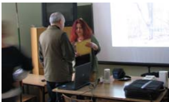
Gimnazjum nr 2 w Olecku.