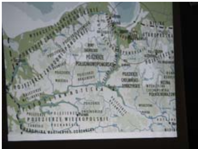
I LO w Elku.

Wśród wielu programów edukacyjnych Centrum Edukacji Ekologicznej w Elku, kierowanych do dzieci i młodzieży szkolnej oraz dorosłych mieszkańców miasta, istnieje cykl Konferencji pt. „Prezentacja obszarów chronionych i atrakcyjnych przyrodniczo”. W 2009 roku mieliśmy przyjemność gościć: Suwalski Park Krajobrazowy, Park Krajobrazowy Puszczy Rominckiej, Park Narodowy Gór Stołowych oraz Park Krajobrazowy Puszczy Knyszyńskiej.