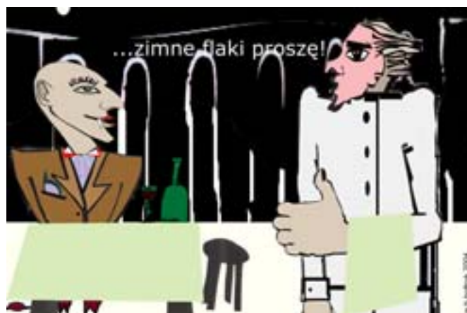
Rys. Wiesław B. Boltryk