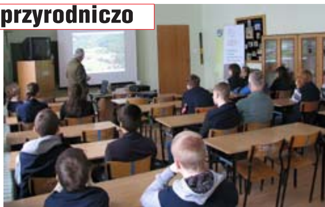
Gimnazjum nr 1 w Olecku.

Konferencji w dniach 15-16 lutego mieliśmy przyjemność odwiedzić wybrane szkoły: SP nr 4, SP nr 5, SP nr 7 oraz I LO z Elku. Podczas wykładu w siedzibie CEE uczestnikami były: SP nr 2, ZS nr 6 oraz ZS nr 3 z Elku. Z kolei we wtorek gościliśmy w czterech szkołach powiatu oleckiego i gołdapskiego, takich jak: Gimnazjum nr 2 w Olecku, SP nr 3 w Gołdapi, ZS w Judzikach oraz Zespole Szkół Licealnych i Zawodowych w Olecku.