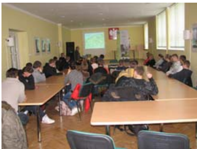
Zespół Szkół Licealnych i Zawodowych w Olecku.