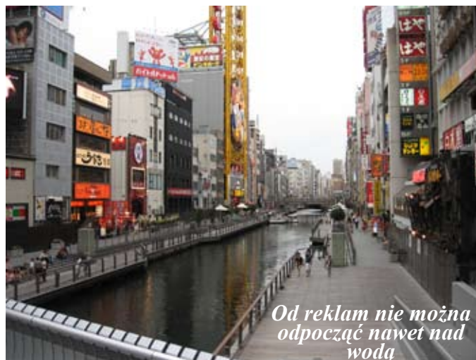
Od reklam nie można odpocząć nawet nad wodą

Wyjazd do Nary odłożyliśmy na inny dzień, bliżej nie zaplanowany. Pojechaliśmy do centrum Osaki w celu poszukiwa-