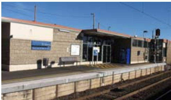
Stacja kolejowa w Albans.