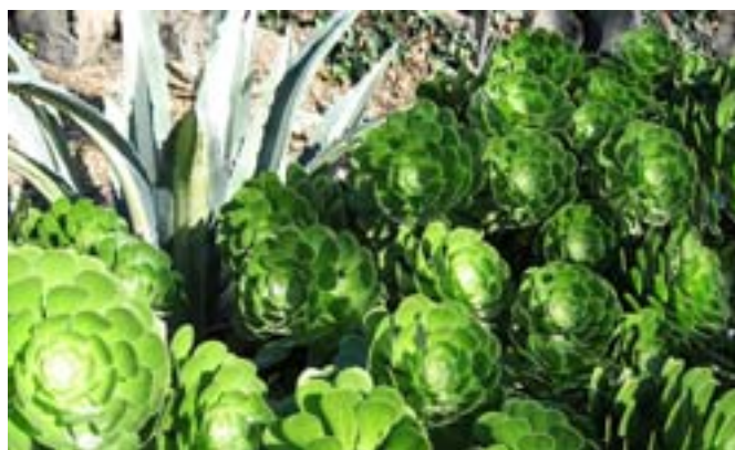
Roślinność w jednym z parków miejskich.

wowych). To bardzo szybka gra, w której dozwolone jest atakowanie gracza, w którego posiadaniu jest piłka, poprzez: chwyt, szarżę, pchnięcie od przodu lub z boku. Niedozwolone jest popychanie w plecy, uderzenia, atakowanie powyżej ramion i poniżej kolan. Poza tym można blokować wszystkich zawodników znajdujących się 5 m od gracza niosącego piłkę. Piłka może być podawana w dowolnym kierunku poprzez jej kop-