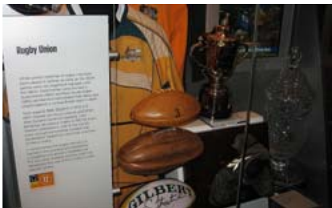
W Muzeum Sportu.

W Nowej Południowej Walii (będę tam za dwa dni) i Queenslandzie najpopularniejszą dyscypliną jest rugby. To ze-