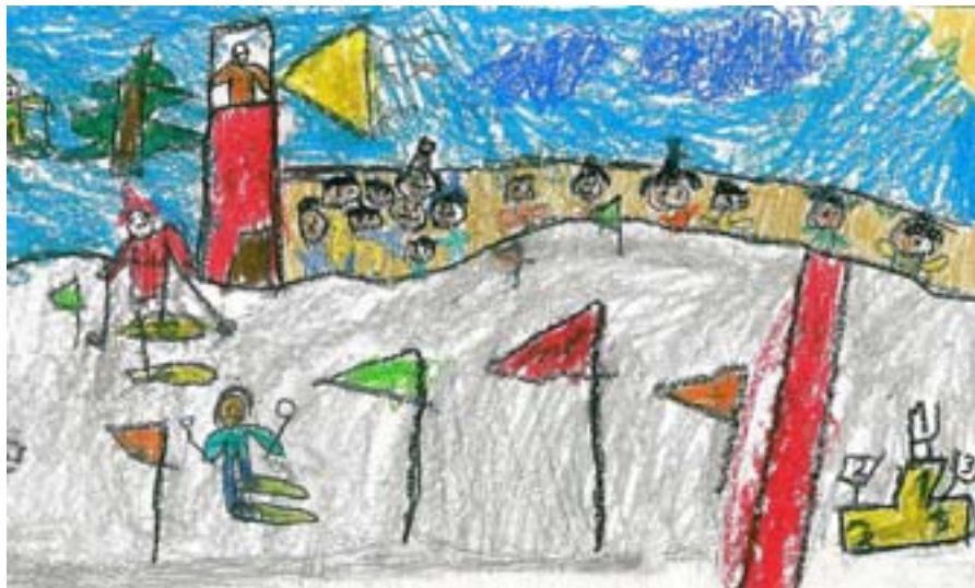
Patryk Jasiński – Szkoła Podstawowa nr 1 w Olecku