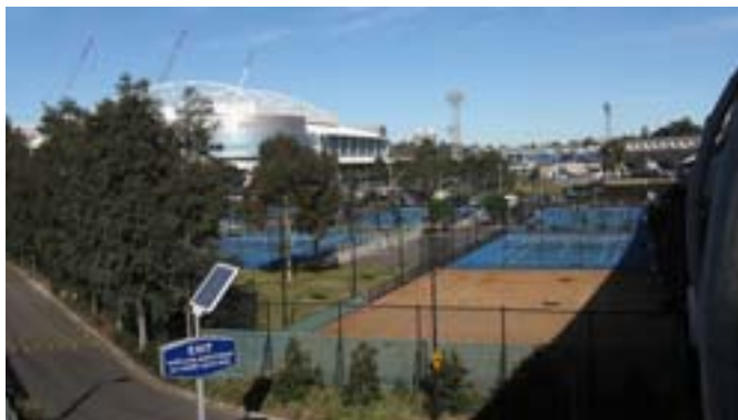
Muzeum sportu i korty tenisowe.

Dzisiaj było bardzo ciepło jak na zimę, bo aż 17 stopni. Cały dzień świeciło słońce. Spotkałem się z naszą grupą i wspólnie zwiedzaliśmy kolejne atrakcje miasta. Pierwsze kroki skierowaliśmy do Muzeum Sztuki Australijskiej NGV Australia. Wstęp bezpłatny. Na trzech piętrach zgromadzono około 70 tysięcy prac. Zbiory obejmują sztukę Aborygenów oraz dawną i współczesną sztukę australijską, która niestety nie przypadła mi do gustu. Można tu oglądać obrazy, maski, figury, figurki, rzeźby, zdjęcia, rysunki, naczynia. Z kolei bardzo mi się podobało Muzeum Sportu. Nie za dużo eksponatów, ale niezły kompleks sportowy – stadion i korty. Hobby Australijczyka to przede wszystkim sport. Również ten oglądany w telewizji. Co piątek o godz. 20.00 cała rodzina zasiada przed telewizorem i wszyscy oglądają mecze rugby. Sport to także olbrzymie pieniądze, które pochłania reklama.