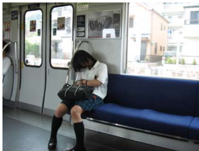
Uczennica w metrze. Śpi, zmęczona nauką