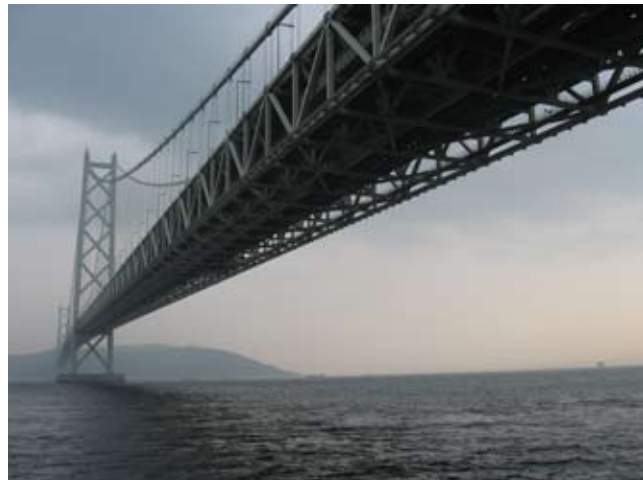
Most łączący wyspy Honsiu i Awalji-shima