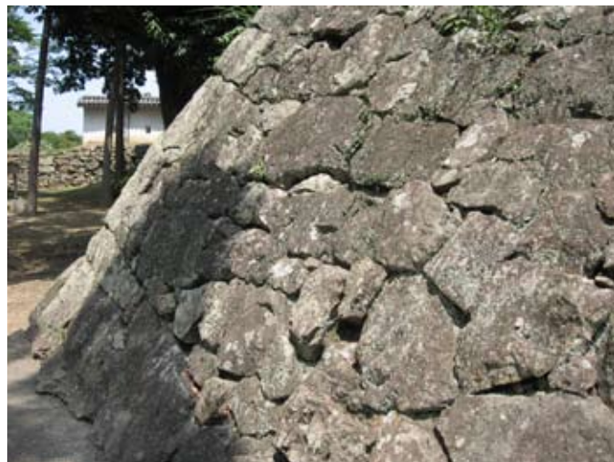
Zamek Białej czapli w Himeji