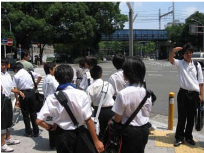
Uczniowie w mundurkach; wracają ze szkoły