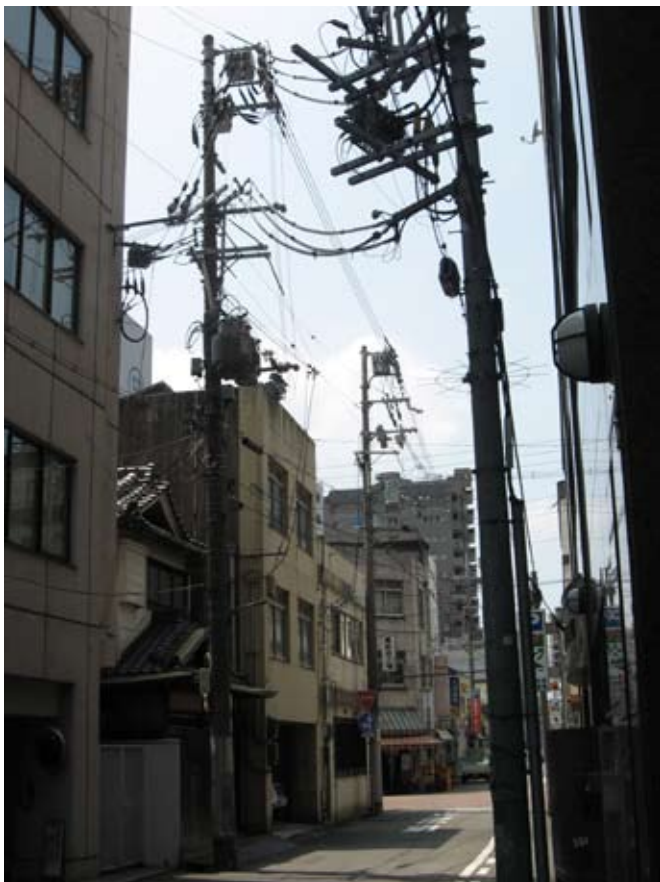
Obrzydliwe przewody. Zmora Japonii