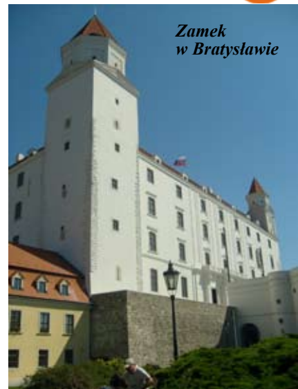
Zamek w Bratisławie

klasy II B Gimnazjum nr 2 im. Mikołaja Kopernika, przebywała w słowackiej miejscowości Bańska Stiavnica (Bańska Szczawnica - tak brzmi polska nazwa) i wzięła udział w trzeciej edycji Międzynarodowej Letniej Szkoły Filmu Dokumentalnego w ramach programu „Patrz i Zmieniaj”. Program ten został opracowany i wdrożony przez Centrum Edukacji Obywatelskiej w Warszawie.