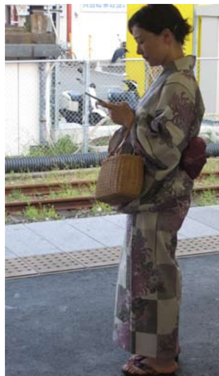
Japonka, kimono, komórka

Długo spacerowaliśmy uliczkami Kamakury. Do Jokohamy wróciliśmy późno. Dzisiaj był niesamowity upał.