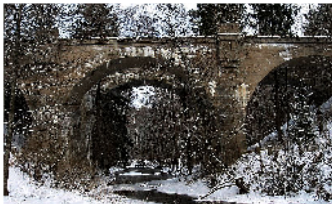
Mosty i rzeka Jarka.

Linia kolejowa Botkuny-Żytkiejmy o długości 36 km była fragmentem linii Gołdap-Żytkiejmy-Gąbin (Gusiew). Zaprojektowano ją w 1907 r. tuż przy granicy prusko-rosyjskiej, ponieważ miała pełnić funkcje strategiczno-militarne. Linię położono na terenie polodowcowym, poprzecinany głębokimi dolinami i wąwozami; dlatego też wybudowano kilkanaście obiektów inżynierskich typowych dla terenów górskich, wśród których najciekawszymi są wiadukty w Stańczykach, Kiepojciach i Botkunach. Wszystkie one miały być dowodem potęgi Prus.