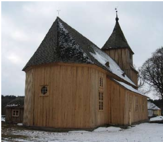
Kościół w Ostrymkole.

W 1538 r. powstała tu pierwsza świątynia. Był to kościół ewangelicki. Podczas najazdu tatarskiego hetmana Gosiewskiego w 1656 r. wieś została doszczętnie spalona. Zginęło