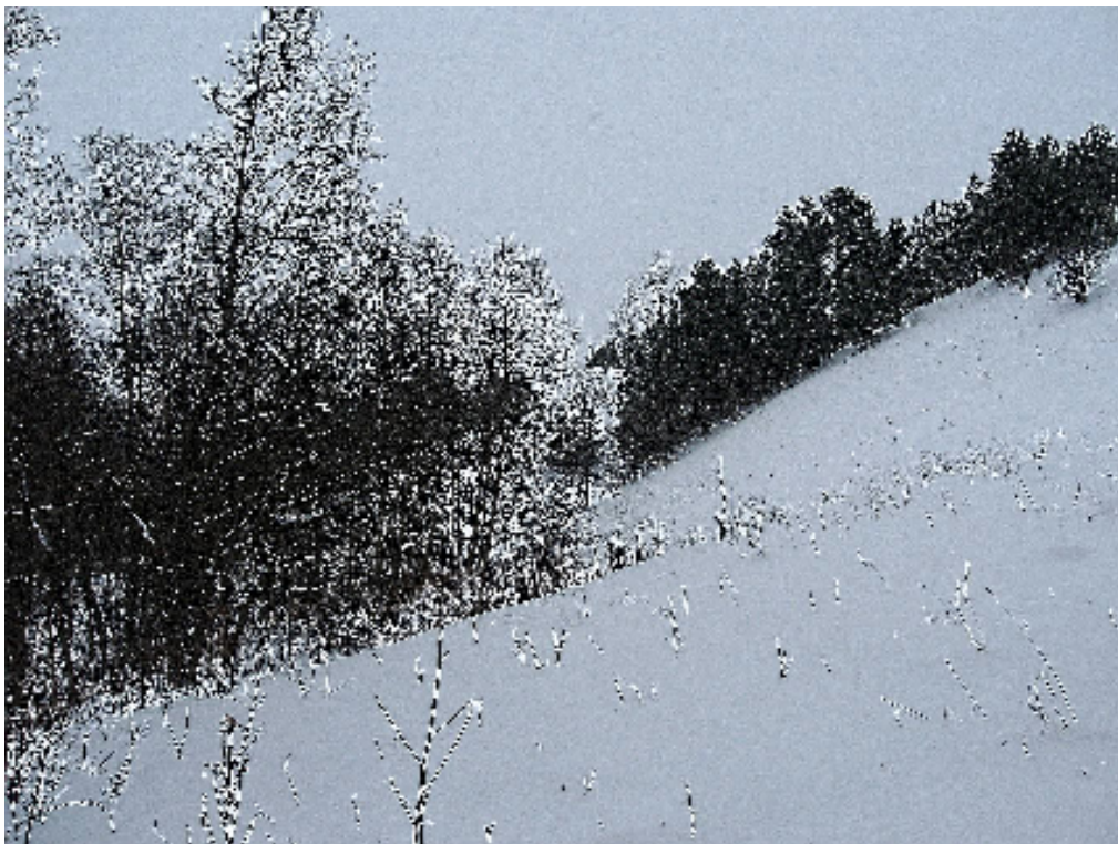
Wachlarzowate równiny sandrowe pokryte śniegiem (Nowa Wieś)