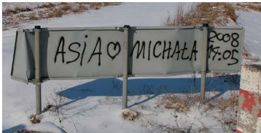
Miłość „na blachę”.