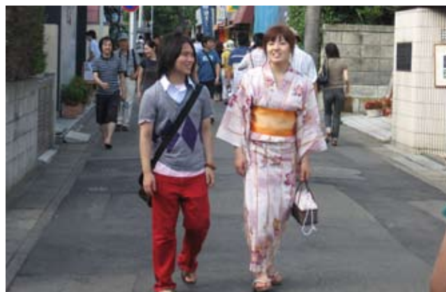
Japonka w kimono

Kimono to ubiór o prostym kroju, w kształcie litery T, przypominający nieco szlafrok. Rękawy są długie, zaś w okolicach nadgarstka także bardzo szerokie – nawet do pół metra. Według tradycji, kobiety nie mające męża powinny nosić kimono o wyjątkowo długich rękawach, sięgających niemal podłogi. Szata