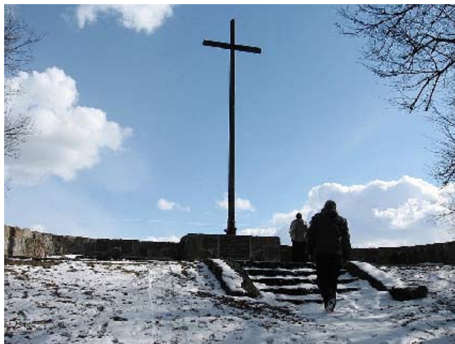
Na szczycie góry Bunelka.

około 95 mieszkańców, a 1326 Tatarzy uprowadzili w jasyr. Odbudowany w 1667 r. kościół przetrwał do dnia dzisiejszego. Po II wojnie światowej przejęty został przez ludność katolicką. W roku 2009 był remontowany.