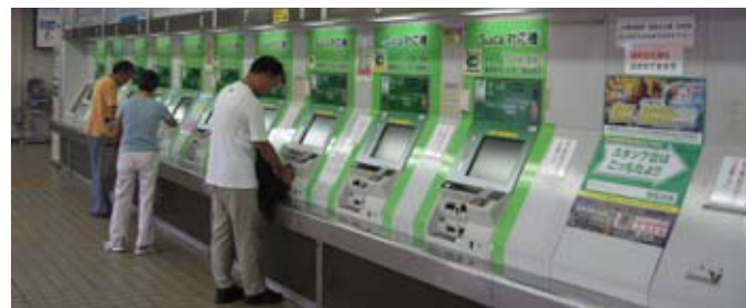
Kupowanie biletów w automatach

200 jenów. Posąg waży 93 tony i ma 11,40 m wysokości. Powstał w 1253 roku, gdy Kamakura była stolicą szogunów (naczelnych wodzów) i jednym z największych miast świata. Żył w niej około 200 tys. ludzi. Miasto było też ważnym ośrodkiem buddyjskim z