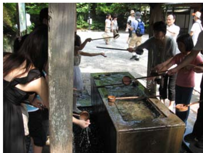
Obrzęd oczyszczenia przed wejściem na teren świątyni

200 jenów. Posąg waży 93 tony i ma 11,40 m wysokości. Powstał w 1253 roku, gdy Kamakura była stolicą szogunów (naczelnych wodzów) i jednym z największych miast świata. Żył w niej około 200 tys. ludzi. Miasto było też ważnym ośrodkiem buddyjskim z