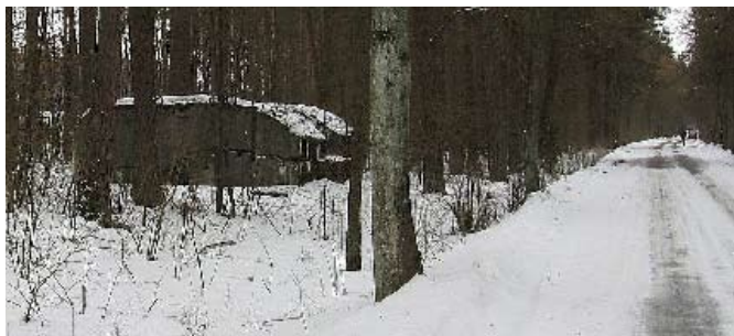
Bunkier przy drodze do wsi Ostrykół.

W pobliżu Prostek, za wsią Bobry, jadąc z Olecka po prawej stronie, znajdują się trzy niemieckie bunkry z okresu II wojny światowej. W jednym z nich dobrze zachował się system wentylacyjny. Inne dwa bunkry znajdują się na trasie Prostki-Ostrykół – przy wjeździe do Prostek, trzeba skręcić w lewo (obok stacji benzynowej) zgodnie z drogowskazem: „Ostrykół 2 km”. Po przejechaniu 1 km, przy samej drodze w lesie stoi niewielki bunkier składający się z dwóch pomieszczeń. Nieco dalej (300 m), po prawej stronie zachował się większy, przełamany na pół. Przy nim, w odległości 50 m znajduje się cmentarz z kilkoma niemieckimi i rosyjskimi grobami. Niestety, jest zaniedbany i nieogrodzony. W bunkrach sterta śmieci.