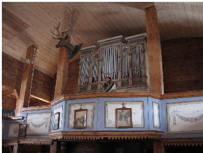
Organy, Czarek i świecznik - jelenia głowa.

Przy kościele, po drugiej stronie drogi, rosną dwa dęby –