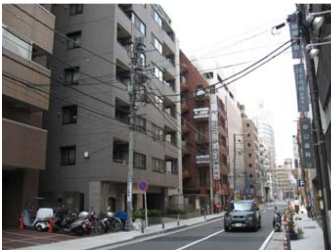
Ulica w Jokohamie