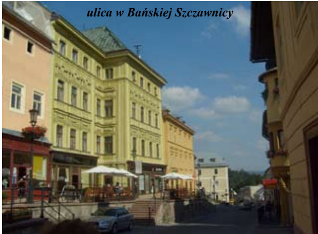
ulica w Bańskiej Szczawnicy