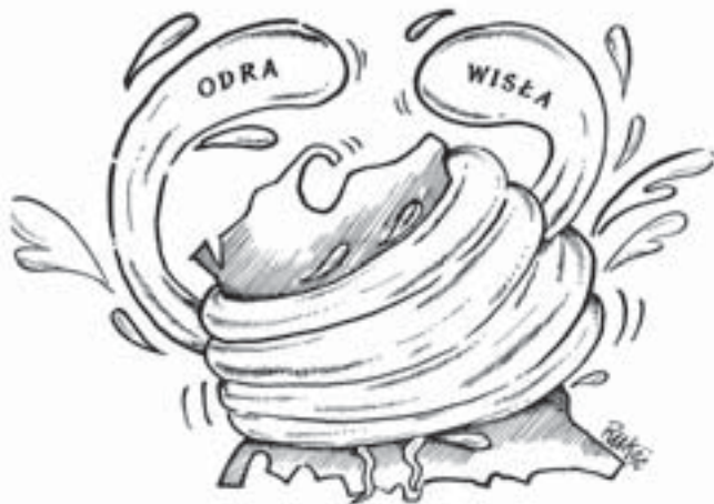
Rys. Waldemar Rukść