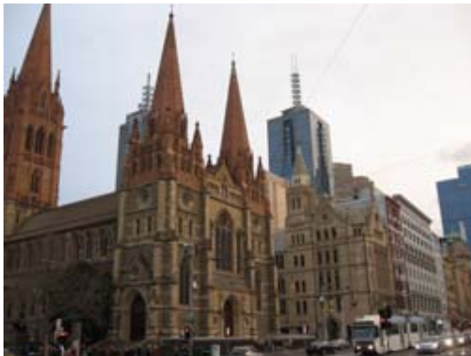
Stare i nowe.

Po intensywnym zwiedzaniu pojechaliśmy do Essendon na mszę św. i spotkanie z Polonią. Było już ciemno, więc mieliśmy kłopoty ze znalezieniem kościoła. Byłem zaskoczony tym, co zobaczyłem. Otóż kościół okazał się być Sank-