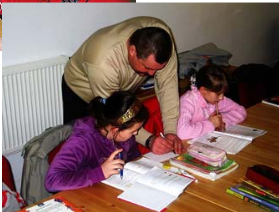
Szczecinki - pomoc w odrabianiu lekcji.