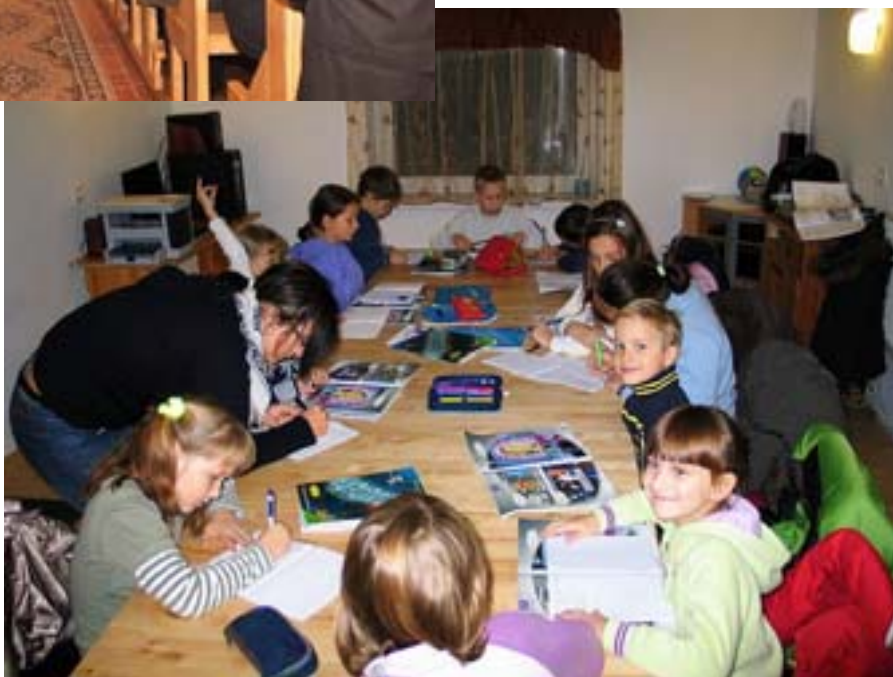
Szczecinki - kurs informatyczny.

„Wychodząc naprzeciw potrzebom dzieci i młodzieży, dla których dostęp do Internetu jest sprawą kluczową w procesie zdobywania wiedzy, w sali katechetycznej zorganizowałem kącik