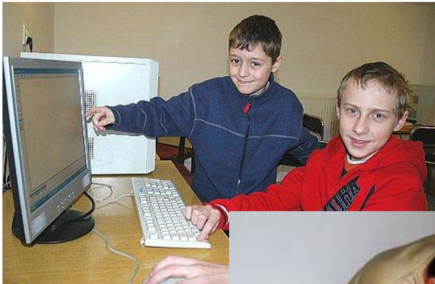
Szczecinki - kurs informatyczny.

Celem konkursu było wyłonienie parafii w Polsce, które w swojej działalności używają nowoczesnych technik informacyjnych i komunikacyjnych, działając jednocześnie na rzecz społeczności lokalnej.