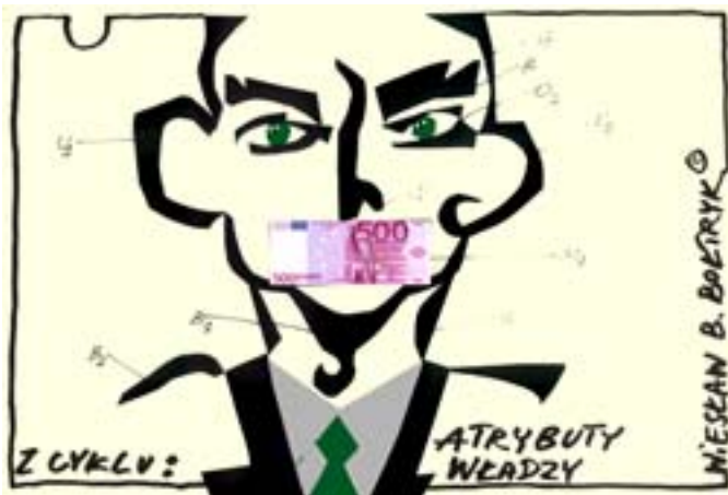
Atrybuty władzy. Rys. Wiesław B. Bołtryk