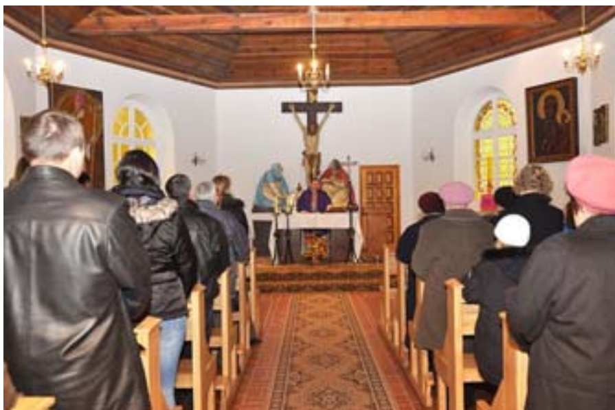
Msza św. – listopad 2009 r.

języka angielskiego, pomoc w odrabianiu lekcji, kursy informatyczne w ferie zimowe, spotkania integracyjne.