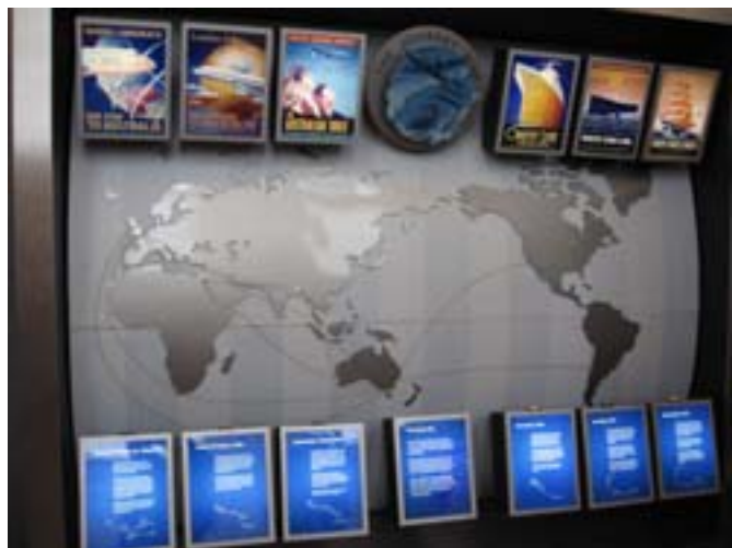
Muzeum Imigracji. Kierunki migracji do Australii.

Ubrani byli zwyczajnie – przeważała szarość płaszczy i kurtek oraz chusteczki na głowach kobiet. Większość wier-