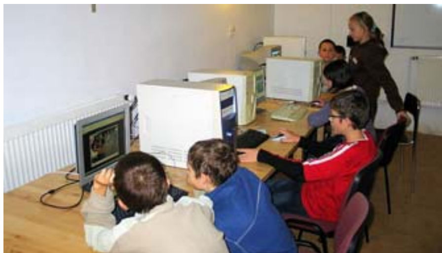
Szczecinki - zajęcia informatyczne.

bowzięcia N.M.P., Radlin-Biertułtowy, diecezja katowicka.