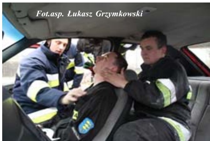
Fot. asp. Łukasz Grzymkowski