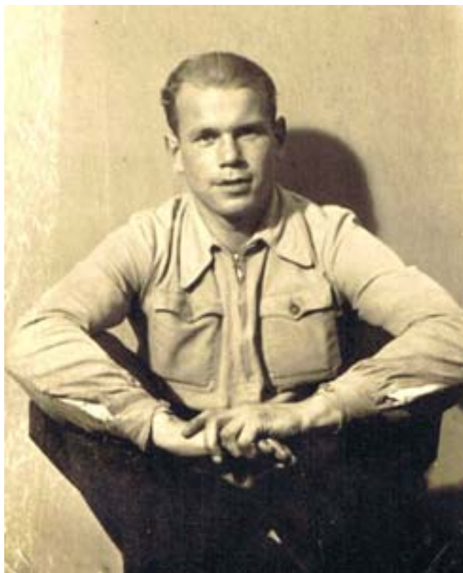
Tolek, Wilno, koniec lat 30-tych.

Na końcu listu zwraca uwagę na konieczność precy-