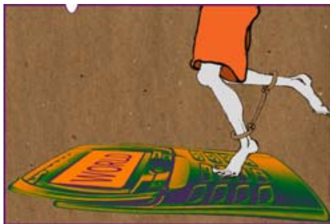
Gra w klasy. Rys. Wiesław B. Boltryk