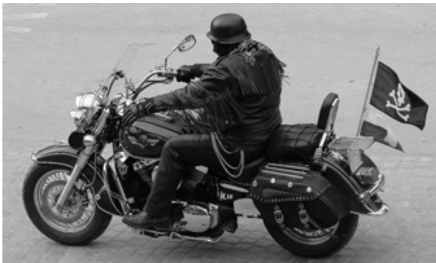
Pirat drogowy?