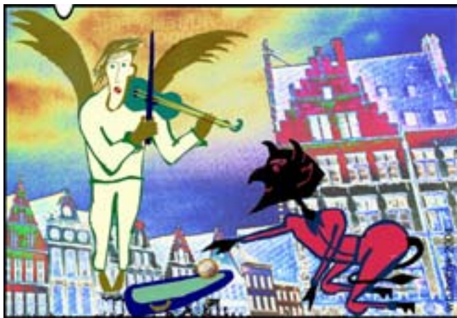
Anioł i... Rys. Wiesław B. Boltryk