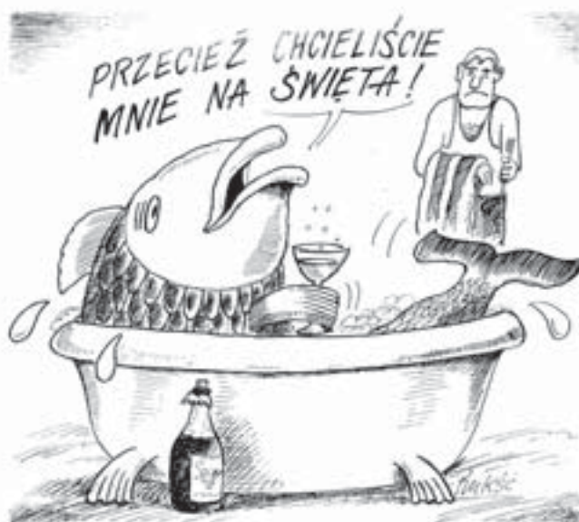
Rys. Waldemar Rukś

Bilet normalny na trasie Olecko-Ełk podróżał o 50 groszy. Obecnie kosztuje 7 zł. (jod)