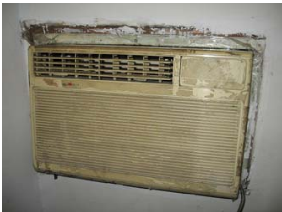
Klimatyzator w moim pokoju.