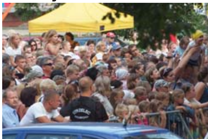
Chętnych do posłuchania było wielu.