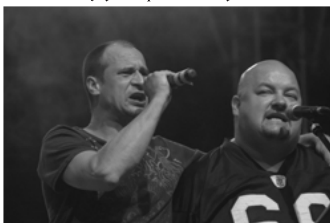
Paweł Kukiz i Piersi