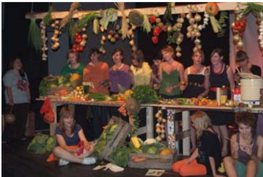
Być kobietą to brzmi dumnie...

AŚ: – To jest taka wspólna praca. Pomysł na samą ideę spektaklu jest mój. Na to, by dziewczyny porozmawiały z mamami, z babciami, spróbowały wyciągnąć od nich różne stare historie. Historie dotyczące ich losów. Próbowali-