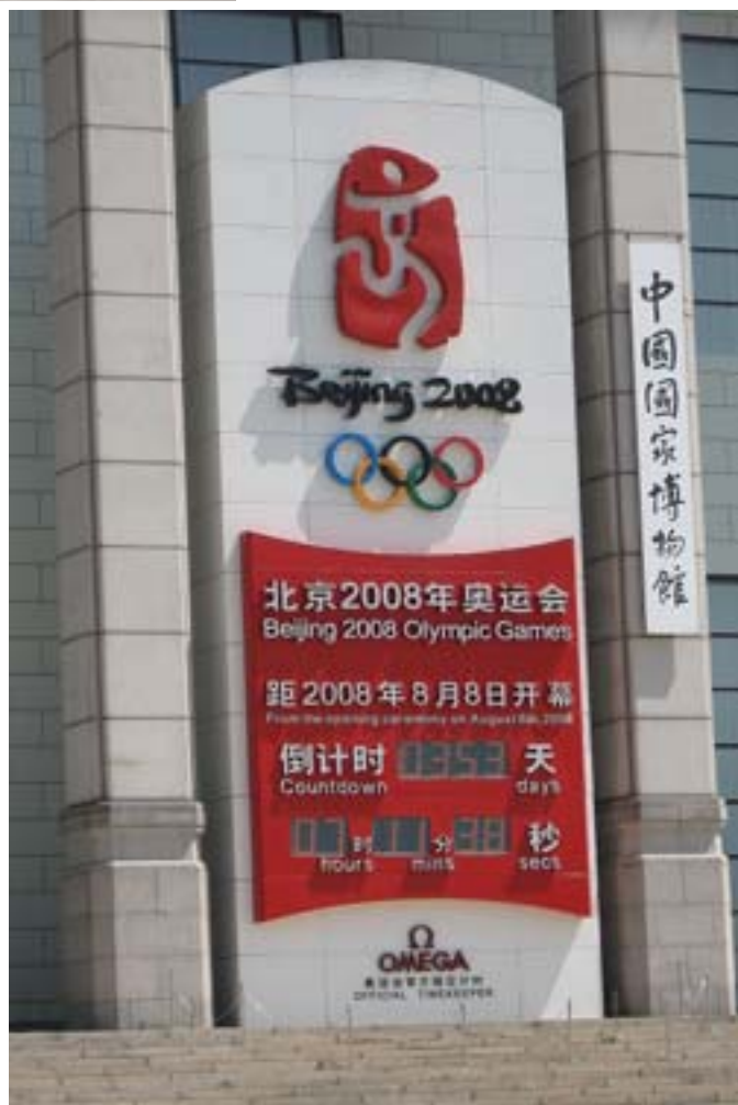
Do Olimpiady w Pekinie zostało 353 dni.

Państwo Środka jest bardzo zróżnicowane. Wielkie miasta nie różnią się zbytnio od europejskich stolic. Stare Chiny można dziś znaleźć tylko na prowincji. Dane statystyczne dotyczące tego kraju (pomijając kwestię ich wiarygodności) są niejasne i niewiele można na ich podstawie powiedzieć. Trudno mówić o średniej pensji, średnim standardzie życia. Jeżeli nawet dowiemy się, że średnia pensja wynosi ok. 100 USD, to nie będzie to informacja wiele wnosząca. Zupełnie inaczej wygląda życie w Pekinie i wielkich miastach (Szanghaju, Kantonie, Hongkongu), a zupełnie inaczej na prowincji, na którą zachodnie inwestycje jeszcze długo nie dotrą.