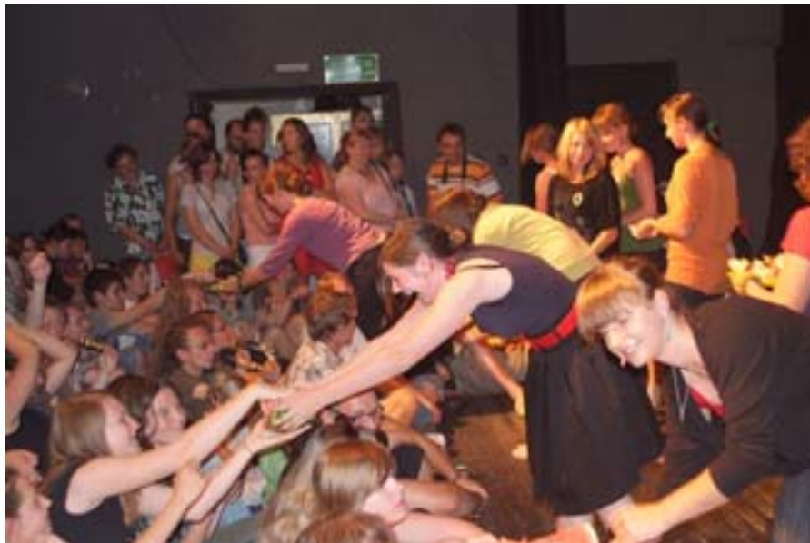
Być kobietą to brzmi dumnie...