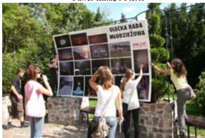
Działania Oleckiej Rady Młodzieżowej