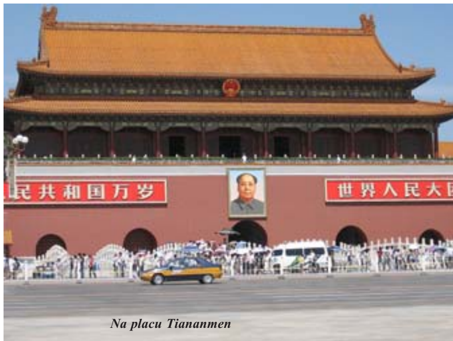
Na placu Tiananmen

Chiny są ogromnym rynkiem zbytu. To karta przetargowa w rokowaniach z zachodnimi koncernami. Sytuacja Chińczyków z roku na rok staje się coraz lepsza. Siła nabywczą pieniądza jest dość duża, w Chinach nie ma inflacji, partia komunistyczna powoli wprowadza reformy gospodarcze. Jak grzyby po deszczu powstają małe firmy (np. warsztaty naprawy rowerów), sklepiki i inne. Młodzi Chińczycy rozumieją, że ich jedyną szansą na nawiązanie kontaktu z zachodem jest nauka angielskiego.