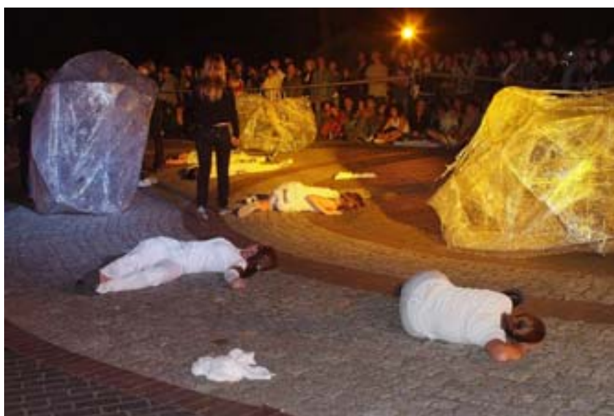
Spektakl „Garby”.

AŚ: – Dziękuję. „Zielona Geś” Gałczyńskiego to moja fascynacja. Jestem zafascynowana w ogóle twórczością tego poety. Z samym zespołem „Amalgat” spotkałam się późno, bodajże w kwietniu. Zostałam poproszona, żeby z nimi pracować. Sprzedałam im swoją fascynację Gałczyńskim. Było bardzo mało czasu do końca roku, a mi bardzo zależało, żeby coś zrobić. Młodzieży zawsze zależy żeby był efekt pracy, żeby mogli coś pokazać. Żeby rok nie był stracony. Bo to był trudny rok dla grup teatralnych w domu kultury. Przyniosłam „Zieloną Geś”. Tekst bardzo im się spodobał. Dokonałszy szybkiego wyboru scen, a potem pracowaliśmy wspólnie. Wspólnie tworzyliśmy sceny, analizowaliśmy pomysły.