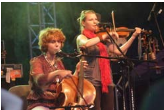
Kapela ze Wsi Warszawa