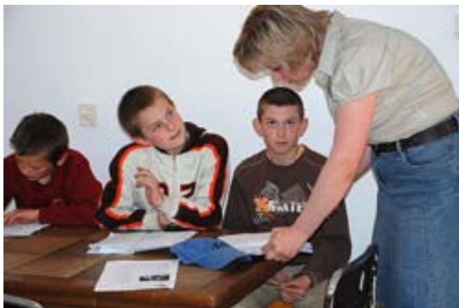
Zajęcia z jęz. angielskiego

W okresie zimowym wśród parafian i w szkołach została przeprowadzona diagnoza potrzeb edukacyjnych. Wiosną specjaliści z Poradni Pedagogiczno-Psychologicznej w Olecku przeprowadzili u wytypowanych dzieci badania umiejętności szkolnych i diagnozę logopedyczną. W efekcie Poradnia wystawiła 8 prawomocnych opinii. Ze zdiagnozowanymi dziećmi od marca do czerwca 2009 roku logopeda i psycholog przeprowadzili ogółem 104 godziny zajęć kompensacyjno-wyrównawczych. Pod okiem specjalistów uczestnicy ćwiczyli prawidłową wymowę, utrwalali zasady ortografii i pisowni. W ramach zajęć prowadzono także instruktaż rodzicom do pracy z dzieckiem w domu. W wakacje na plebanii nadal funkcjonuje punkt psychologiczno-konsultacyjny.