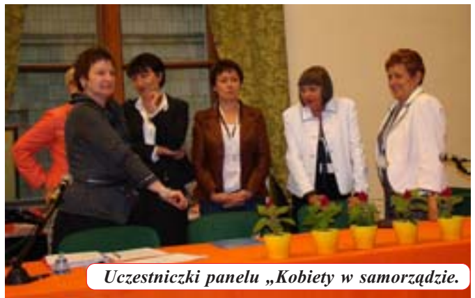
Uczestniczki panelu „Kobiety w samorządzie.”

MWD: – Tak jest najczęściej. Dlatego należy odczarować stereotypy i zakłamania. Innym z problemów jest skuteczność systemu edukacji. To jest nie tylko moje zdanie. Wiele kobiet profesorek, wykładowczyń, zarządzających oświatą mówiło o tym problemie. Nasza edukacja jest bardzo kulawa. Szkoła nie przygotowuje do