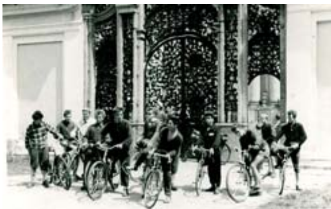
Święta Lipka – przed bramą sanktuarium.

Wróciliśmy cali i zdrowi, bez żadnego urazu.