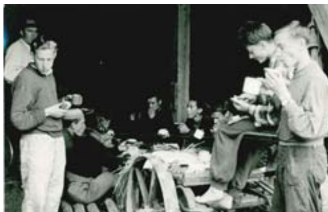
Elbląg – kolacja w stodole.