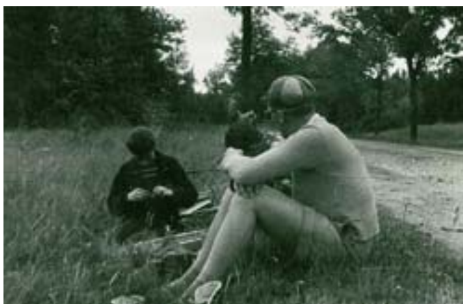
Odoczynek na trasie. Przy okazji usuwanie usterek.