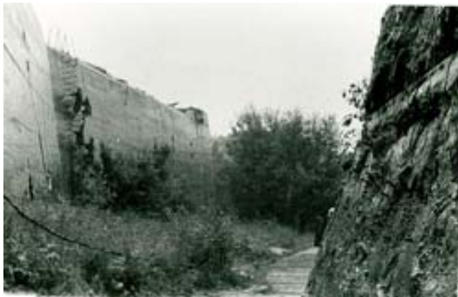
Gierłoż – zdobywanie bunkru.