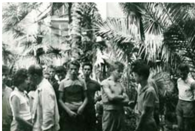
Palmiarnia w Oliwie.