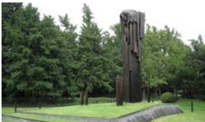
Pomnik Chopina w Szanghaju

Wczoraj wieczorem długo siedziałem w internecie, ponieważ za wszelką cenę chciałem znaleźć informację na temat dokładnego miejsca znajdowania się pomnika Chopina. I udało się! Oczywiście zadziałał tu przypadek, albo dziwny traf. Cały szkopał był w tym, że nazwy parków na mapach czy w internecie podawane są w angielskim, albo „dziwnym” tłumaczeniu chińskiego. Okazało się, że stoi on w Parku Zhongshan (Ludowym), 2. stacje metra ode mnie. Postanowiłem pójść tam pieszo.