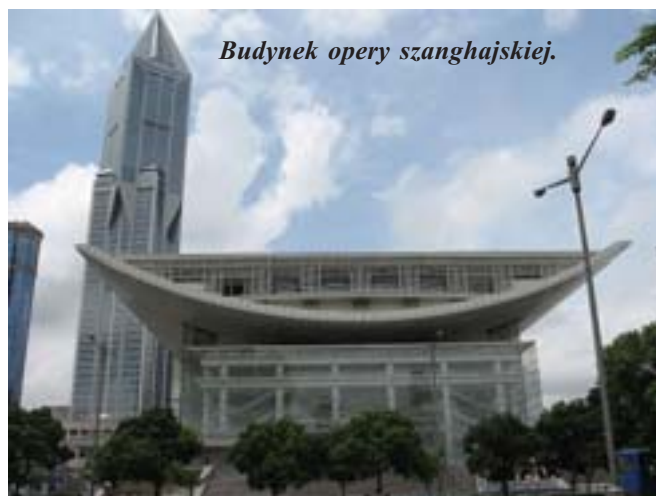
Budynek opery szanghajskiej.

Niebiański smok Lung uważany jest za najpotężniejszego ze wszystkich smoków. Smok wodny Li nie ma rogów i żyje w oceanie. Smok Chao z kolei pokryty jest łuską i zamieszkuje bagna lub grotty górskie. Już w starożytności przedstawiano go na ścianach świątyń. Była to forma daniny dla kapłana podziemnego królestwa i jednocześnie zaklęcie przeciwko złym duchom. W Chinach, nad dachami domów zawsze umieszczano wizerunek smoka.