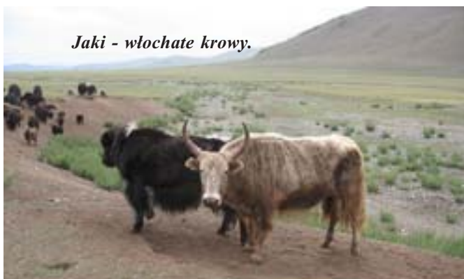
Jaki - włochate krowy.

Najpierw gospodarze zaprosili nas do swojej jurty i ugościli gambirami – ciasteczkami smażonymi na urumie – maśle. Urum przygotowuje się z mleka. Gotujące się mleko jest rozbełtywane, aż na jego powierzchni utworzy się kożuch, który jest zdejmowany, studzony i suszony. Częstuje się nim goście odwiedzających jurty. Spożywa się je bez dodatków, bądź z wysuszonym serem albo twarogiem. Można je również dodać do herbaty. Widziałem jak Mongołka przyrządzała gambiry