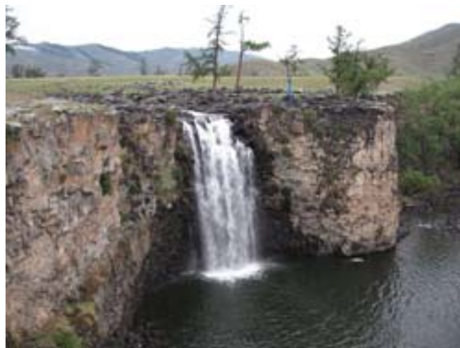
Wodospad Orhon Hirhree.

i smażyła, na naszych oczach. Piliśmy słoną suute-caj .