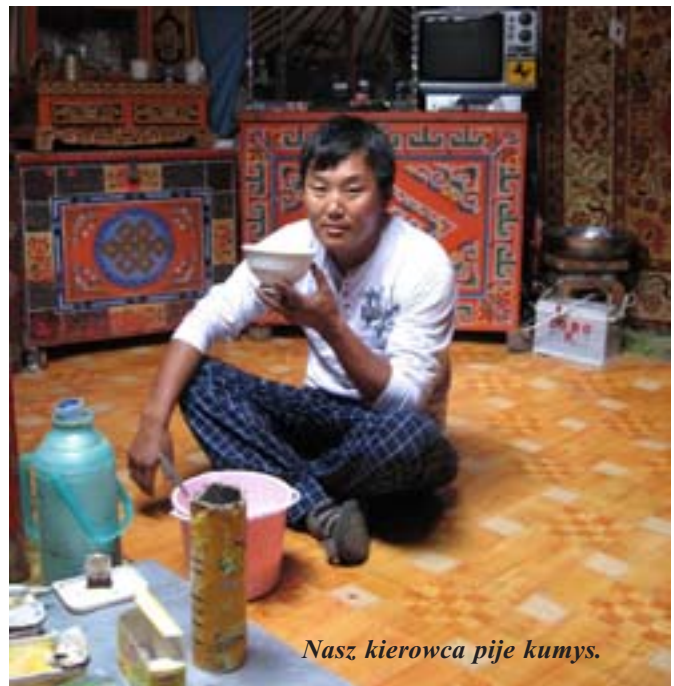
Nasz kierowca pije kumys.

wie, z jaką to robi, niemal nie odczuwa drgań powodowanych przez biegnącego konia. Z pozoru niechlujna, jakby podparta na którymś z westernów, postawa jeźdźcy (wykrzywiona, przygarbiona, z jedną nogą ugiętą, a drugą zwisającą swobodnie), znakomicie sprawdza się w tutejszych warunkach. Na galop Mongołowie też mają sprawdzony sposób. Stają wtedy w strzemiączkach na wyprostowanych nogach. Potrafią w tej wydawałoby się niebezpiecznej pozycji rozwijać niebywałe prędkości.