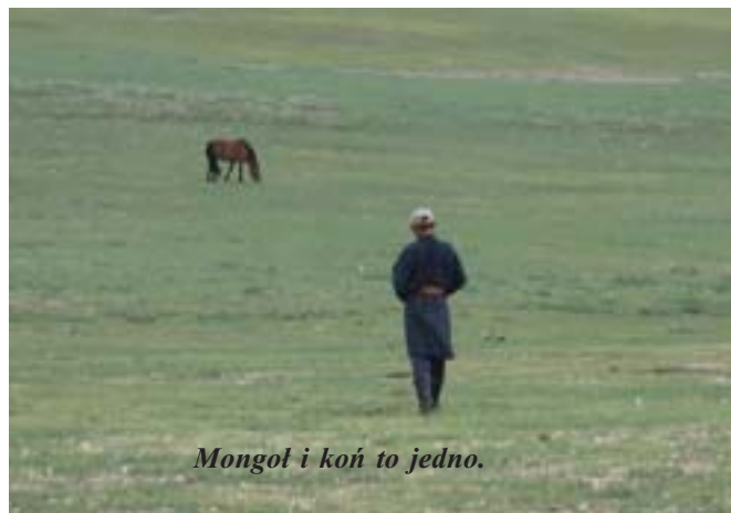
Mongoł i koń to jedno.

Poszliśmy nad wodospad Orhon Hirhree. Położony jest