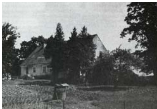
Dawna szkoła w Zawadach - 1989.

do Saksonii, a kolumna zakończyła swój marsz w gminie Grabowo w powiecie Mrągowo, gdzie dzieci z Zawad przez jakiś czas uczęszczały do szkoły, zanim zaczęła się ucieczka.