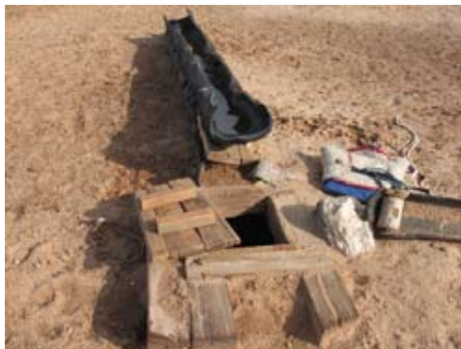
Studnia na pustyni.