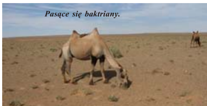
Pasące się baktriany.

W Mongolii żyły także podobne do strusia ornitomimozauzy. Prawdziwym olbrzymem był Deinocheir. Znaleziono tylko