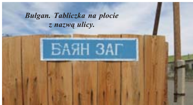
Bułgan. Tabliczka na płocie z nazwą ulicy.

Do unikalnych znalezisk należą połączone szkielety dra-