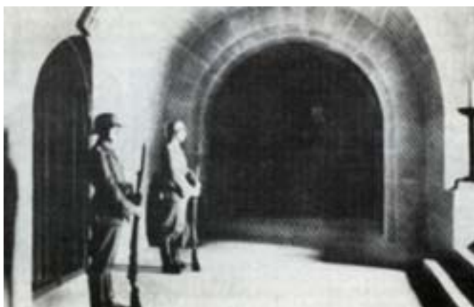
Warta przed grobowcem Hindenburga przy pomniku ku czci poległych od Tannenbergiem

Celem kolejnej czterodniowej wycieczki w sierpniu 1939 roku był pomnik w Tannenbergu. Znowu jechaliśmy wozem drabiniastym na dworzec w Gryzach i dalej pociągiem do Giżycka. Tam zwiedziliśmy twierdzę Niegocin i udaliśmy się na nocleg do schroniska młodzieżowego. Statkiem płynęliśmy wśród jezior do Mikołajek i dalej przez jezioro Nidzkie do Rudczan. Zakwaterowani zostaliśmy także w schronisku w Wojnowie w Puszczy Piskiej. Po romantycznej przeprawie przez Krutyńię i długim marszu przez las w kierunku dworca w Karwicy, pociąg zabrał nas przez Szczytno, Olsztyn do Olsztyńka. Wszyscy byliśmy pod wrażeniem pomnika upamiętniającego bitwę. Na tablicy pokazowej z sygnałami świetlnymi można było śledzić przebieg bitwy pod Tannenbergiem. Pełni skupienia obserwowaliśmy ceremonię zmiany warty przy Grobowcu Hindenburga, miejsca spoczynku szanowanego przez wszystkich mieszkańców Prus Wschodnich feldmarszałka Paula von Beneckendorfa-Hindenburga i jego żony. Jedną z uczennic była szczególnie ciekawska. Chciała dokładnie wiedzieć, czy ci tkwiący w spokoju strażnicy rzeczywiście żyją. Po tym jak jeden z żołnierzy lekko się poruszył, jej wątpliwości rozwiały się.