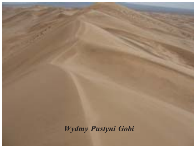
Wydmy Pustyni Gobi