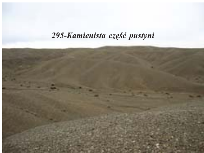
295-Kamienista część pustyni