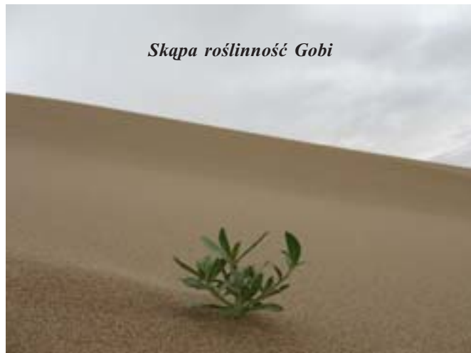
Skąpa roślinność Gobi