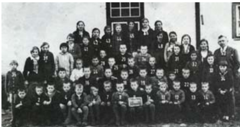
Szkoła w Zawadach - 1932