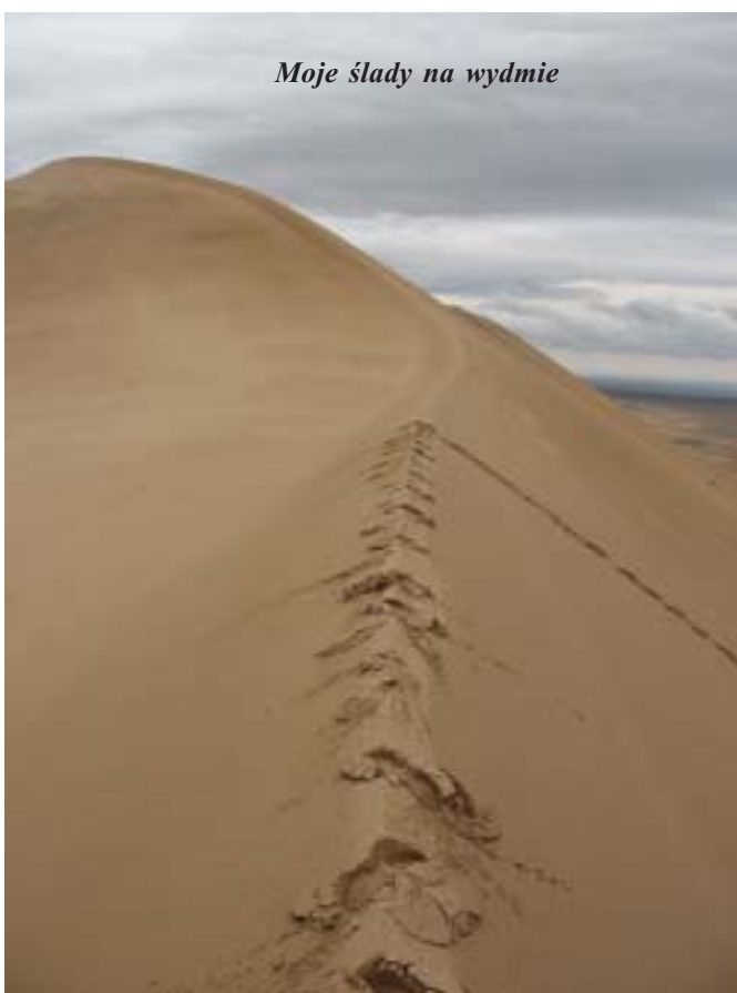
Moje ślady na wydmie

Dzisiaj warunki ku temu, by spotkać się z robakiem były sprzyjające. Ponadto zaczął padać deszcz. Niestety do spotkania nie doszło.