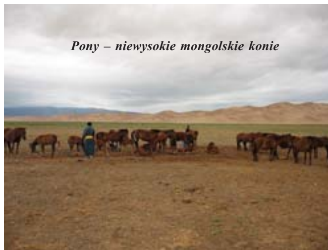
Pony – niewysokie mongolskie konie

Do najrzadszych zwierząt zamieszkujących Gobi należą: Koń Przewalskiego (endemit gobijski, nie jest pewne czy jeszcze tam żyje w stanie dzikim, natomiast jest na Gobi hodowla zmierzająca do restytucji Koni Przewalskiego), kułan – pół osioł pół koń i pantera śnieżna.