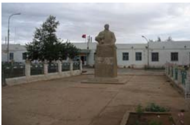
Pomnik Lenina w mongolskim miasteczku