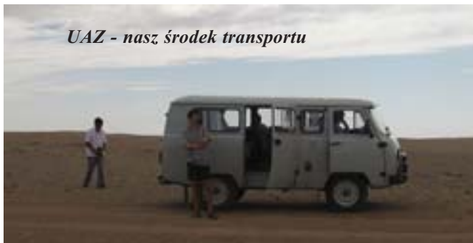
UAZ - nasz środek transportu

niej jak i teraz jedzenie ludów koczowniczych jest sezonowe. Mongolskie jedzenie jest dobrze przystosowane do warunków klimatycznych i bazuje w znacznej części na własnych produktach, głównie mlecznych. Najbardziej popularne są kumys, kefir, urum (gruby twaróg (aaruul), biały ser. Dawniej Mongołowie mięso jedli głównie zimą, gotując je krótko na bardzo silnym ogniu prawie bez soli, a także suszyli je na powietrzu pokrojone na długie kawałki, które nazywa się borc. W ten sposób przygotowane mięso może leżeć w suchym miejscu przez długi okres czasu. Jedli go latem kiedy raczej bywała nie zabijali.