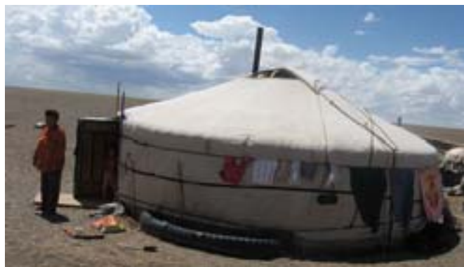
Jurta(mongolski dom) na pustyni