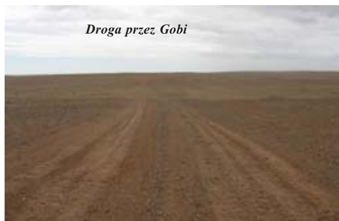
Droga przez Gobi

Oprócz baktrianów były tu i inne zwierzęta, chociaż zde-