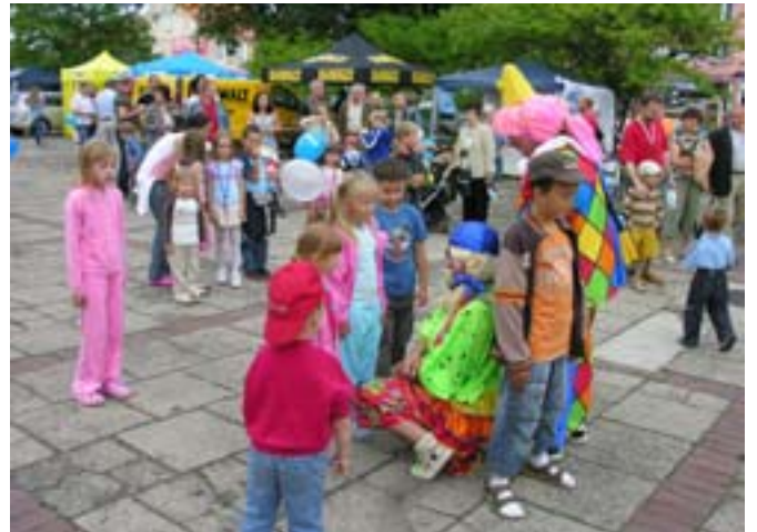
Fotoreportaż na s. 7. – Marta Jeżewska