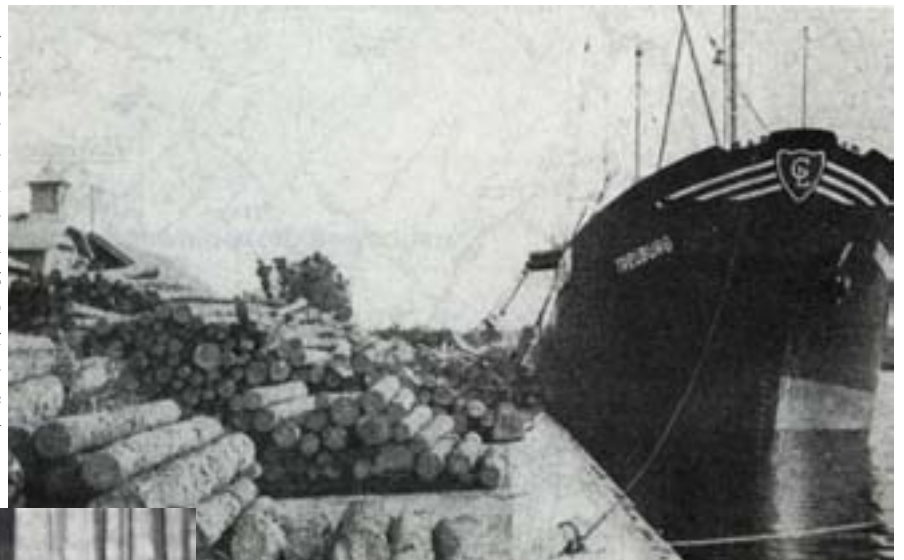
„TREUBURG” – ładunek pni drzew w porcie w Nyköping (Szwecja)