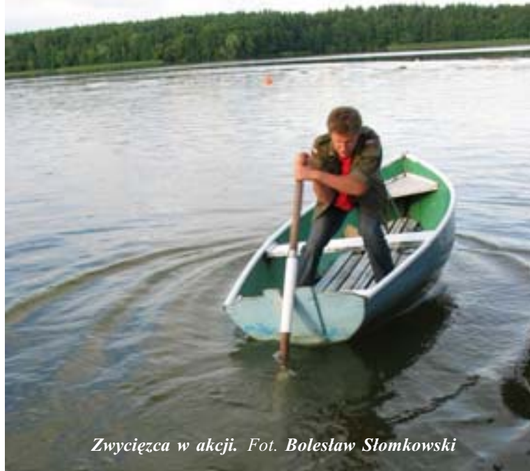
Zwycięzca w akcji.