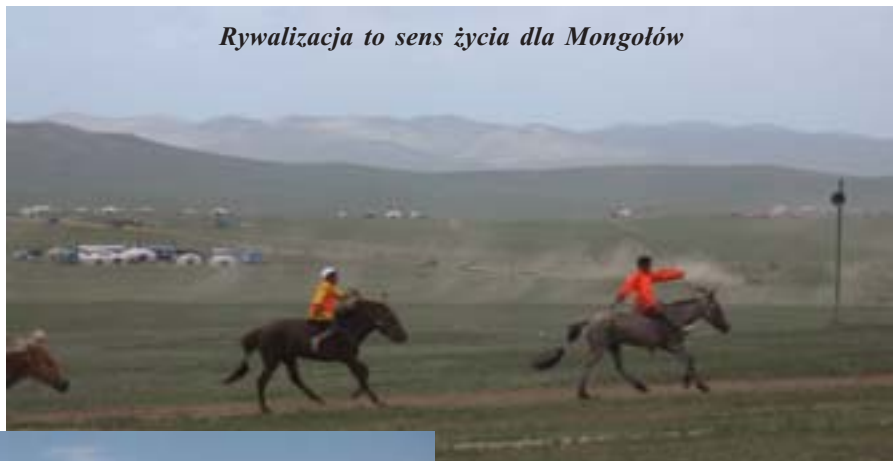
Rywalizacja to sens życia dla Mongołów

Wstaliśmy o godz. 8.30. Łóżko nieznacznie twarde. Same deski. Śniadanie mieliśmy wliczone w cenę noclegu – chleb (nareszcie), masło, dżem i kawa. Hostel zaoferował nam, oczywiście odpłatnie po 15 dolarów od osoby, wyjazd UŁAZ-em 25 km za Ułan Bator na step, gdzie odbywają się wyścigi konne. Na asfalcie trzęsło, a kiedy wjechaliśmy na step – kurzyło. Na wzgórzach sporo ludzi i straganów (w jurtach). Zabawy, gry zręcznościowe i sprawnościowe. Popularne jest tu zbijanie puszek, oczywiście naj-