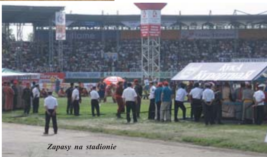
Zapasy na stadionie

Wczoraj odbywało się strzelanie z łuku. Do tej dyscypliny w latach 60. XX wieku dopuszczono