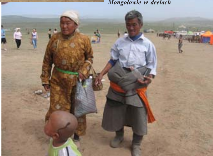
Mongolowie w deelach

Najważniejszy w tym wszystkim jest Naadam – trzydniowe święto państwowe dla uczczenia uzyskania niepodległości (11-13 lipca). To inaczej 3 męskie gry – strzelanie z łuku (było wczoraj), wyścigi konne i zapasy. Kiedyś organizowano je przed wyprawami wojennymi, jak i po zwycięskich wojnach. Byłem rad, że na własne oczy mogę zobaczyć, jak obchodzi się to święto. Najważniejsi jeźdźcy, łucznicy i zapaśnicy zjeżdżają w tych dniach do Ułan Bator, by rywalizować ze sobą. Rywalizacja jest sensem życia dla Mongołów. W każdej stolicy ajmaku (województwa) odbywa się Naadam, ale w Ułan Bator ma największe znaczenie. Zwycięzcy są opiewani w pieśniach i wierszach. Sława o nich dociera do najdalszych zakątków Mongolii. Z przyjemnością uczestniczy-