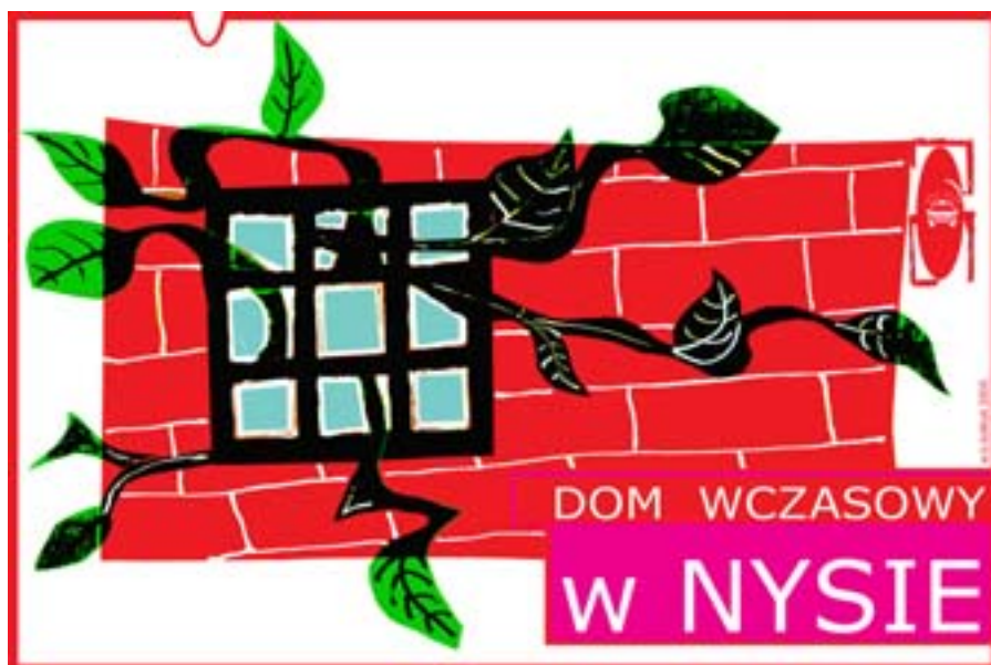
Rys. Wiesław B. Boltryk