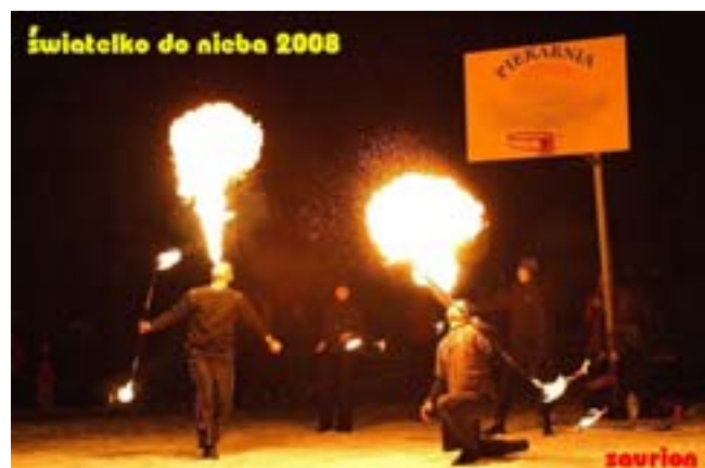
Mimo mrozu, było jak w... piekarni.

Wzory formularzy zeznań wraz z objaśnieniami umieszczone są na stronie internetowej Ministerstwa Finansów: www.mofnet.gov.pl