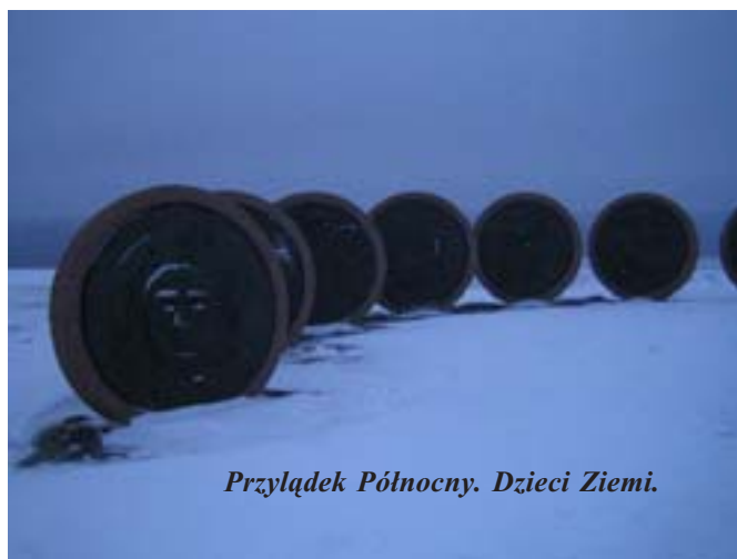
Przylądek Północny. Dzieci Ziemi.

Drżeliśmy z zimna. Nie pomagały nawet kurtki. Ledwie mogliśmy robić zdjęcia. Podeszliśmy dalej i zobaczyliśmy pomnik Dzieci Ziemi, który przedstawia postać kobiety i siedem dużych kół. Został on stworzony przez siedmiorgo dzieci ze wszystkich kontynentów. Symbolizuje nadzieję, przyjaźń, szczęście i współpracę ponad granicami dzielącymi kraje. I najważniejsze... symbol przylądka – duży metalowy globus, który obraca się podczas silnego wiatru. Stoi w tym miejscu od 1978 roku. Każdy z nas fotografował się na jego tle. Ja nawet kilka razy. Za globusem, olbrzymi, 307. metrowy obryw.