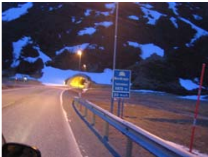
Wjazd do tunelu pod Oceanem Arktycznym

Ks. Darek jechał bardzo zuchwale. Nie było to zbyt bezpieczne. Dzień trwał praktycznie całą dobę. Przejedźdaliśmy przez trzy tunele wykute w skale, ale w środku z „sufitu” ciekła woda. Najdłuższy, trzeci tunel miał 6,8 km długości i prowadził pod dnem Oceanu Arktycznego. I właśnie wtedy,