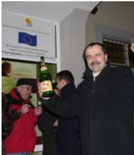
Powitanie Nowego Roku