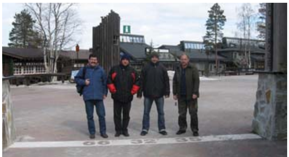
Linia północnego koła podbiegunowego.