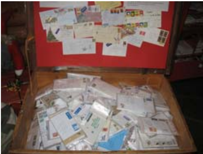
Skrzynka z listami do św. Mikołaja

terytorium fińskiej Laponii – 180 tysięcy (ok. 2,1 osoby / km 2 ). Rdzenni mieszkańcy Laponii to Samowie. Jest ich w sumie 50 tysięcy.