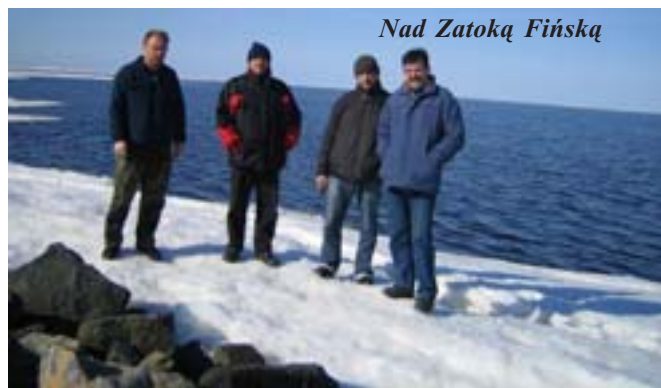
Nad Zatoką Fińską

Oczywiście wszystko w kolorze czerwonym. Mimo wszystko panuje w tym miejscu niesamowita aura. I ta świadomość kręgu polarnego. I jak małe dzieci cieszyliśmy się z tej białej linii, narysowanej na asfalcie – że my w tym miejscu, o tej porze. Przechodziliśmy na zmianę z jednej strony na drugą.