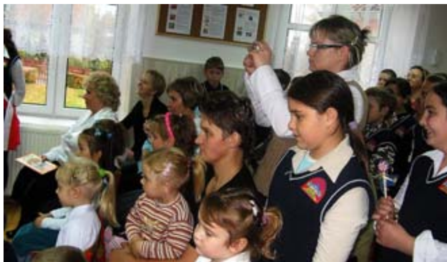
Grono pedagogiczne, uczniowie i rodzice z uwagą obserwują występy uczniów.

Na chwilę przed rozpoczęciem części artystycznej wprowadzono sztandar i odśpiewano hymn narodowy. Po tej podniosłej chwili pierwszaki odtańczyły poloneza, a następnie „rzucano je na łaskę” uczniów klasy drugiej. Drugoklasiści przetestowali wiedzę swoich młodszych kolegów z zakresu matematyki, przyrody, ortografii. Nasi milusińscy nie mieli także problemu z określeniem tego, jak bezpiecznie przejść przez jezdnię. Uśmiech na twarzach wszystkich zgromadzonych wywołała