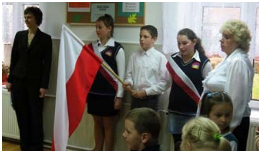
Uroczyste odśpiewanie hymnu narodowego.

Dyrekcja i Rada Pedagogiczna Szkoły Podstawowej w Stożnem przyjęły do