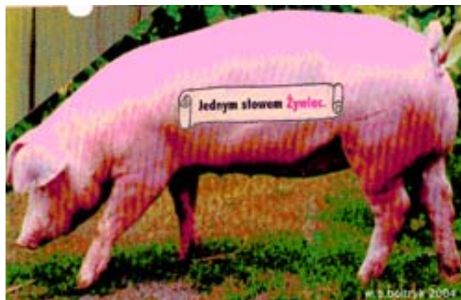
Rys. Wiesław B. Boltryk

Aktem notarialnym przekazano też nieruchomość położoną przy ul. Kasprowicza, a przeznaczoną na poprawienie warunków zagospodarowania. Sprzedano również trzy nieruchomości gruntowe położone przy ul. Targowej.