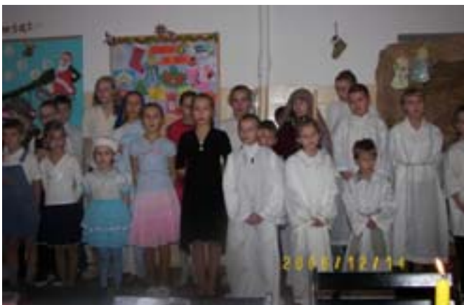
Zdjęcie ze świetlicy Nasz Dom, do której chodzi młodzież ze szkolnego Koła Caritas