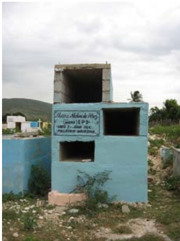
Jimani. Na cmentarzu

Na jednym z postojów cwaniaczek powiedział ostrym tonem, że na tym odcinku trasy napadają na cudzoziemców i ich okradają. Potem na następnym postoju powiedział, żeby dać mu aż 2000 gourdenów (prawie 50 dolarów) za ten cholerny przejazd. Podkreślił, że jeden