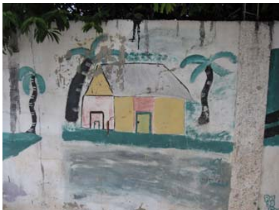
Jimani. Dominikańskie graffiti