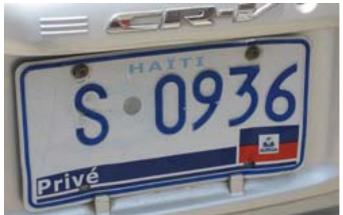
Tablica rejestracyjna pojazdu.

Po wyjściu z kościoła było już chłodniej, około 25 stopni. Do hostelu wróciliśmy po godz. 20. Spacerowaliśmy po brudnym nadbrzeżu. Niektóre dzieci na nasz widok były zdezorientowane, krzyczały „biały”.