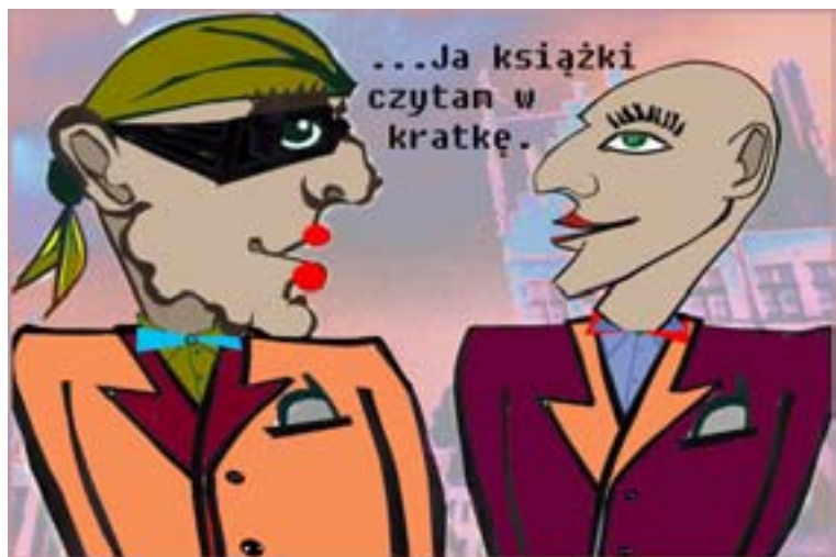
Rys. Wiesław B. Boltryk

*** Zasypiam i żegnam się z Tobą... Słyszysz jak pukam do pustego sumienia? Do spuszczonej oczu z niewyraźną twarzą, Nieszczerego uśmiechu i niezrozumienia Życia naszego utraconego?... Otwórz proszę nicą Twoją, Podaj rękę i wyciągnij...z życia wnioski, Bo to koniec. NAS JUŻ NIE MA.