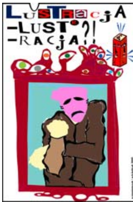
Rys. Wiesław B. Boltryk