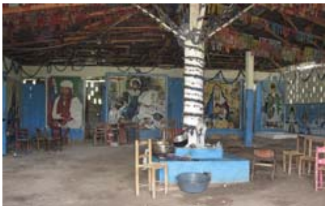
Jacmel. Świątynia voodoo

Zwiedzaliśmy miasteczko. Poszliśmy też nad morze i odpoczywaliśmy tu trzy godziny. W drodze powrotnej zauważyliśmy dość dużych rozmiarów niebieską szopę. Wieczorem była tu „impreza” – miejsce, w którym odbywają się praktyki voodoo (wudu). Zajrzeliśmy oczywiście do środka. Palenisko, rozwalone krzesła, dziwaczne obrazy na ścianach.