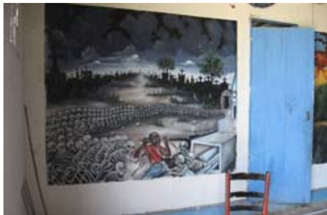
Jacmel. Dekoracja świątyni

To proste słowo – voodoo – wywołuje serię okreśło-