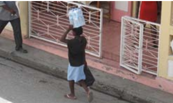
Jacmel. Silna kobieta

Spotkania żyjących ze zmarłymi są na porządku dziennym. Relacje między nimi są rytualizowane i konwencjonalne; mają publiczny charakter, nie wzbudzają strachu, są nieosamotnione, nie zepchnięte na margines, ich forma organizuje życie Haitańczyków w ściśle określony sposób.