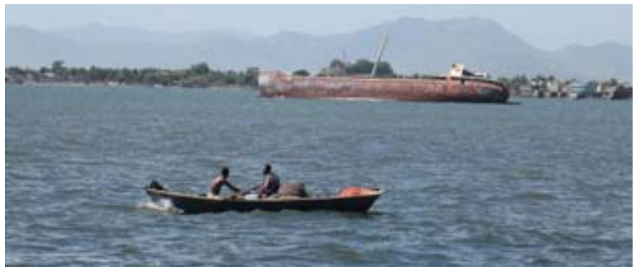
Cap-Had'tien. Haitanczyki na łodzi

Kiedy weszliśmy na hotelowy taras, znajdujący się na dachu, żeby zobaczyć z góry miasto, byliśmy przerażeni. Cap-Haitien pogrążone było w egipskich ciemnościach. Ulice nieoświetlone i brak światła