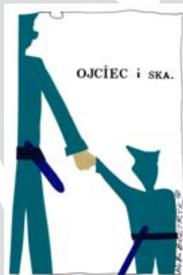
Rys. Wiesław B. Bołtryk

Bo czy las nam zahuczy jak morze, czy w bruk miasta uderza nasz krok, w naszych sercach trzepocze się orzeł, każdy pancerz przepali nasz wzrok.