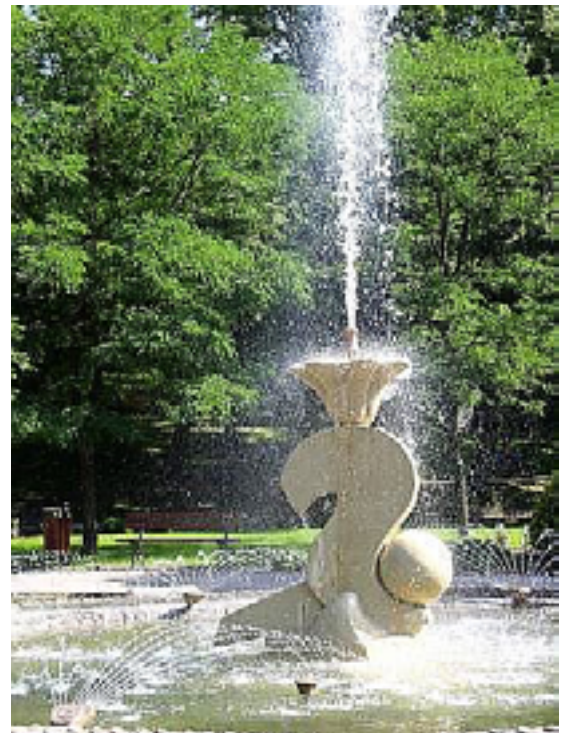
Fot. Alicja Mieszuk