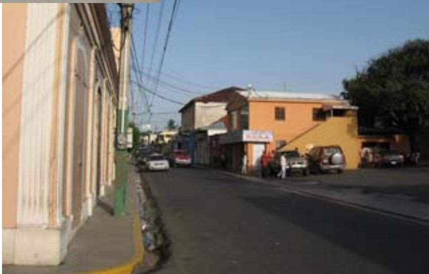
W Puerto Plata