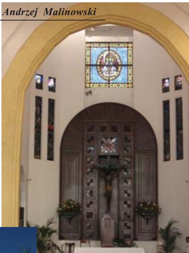
Puerto Plata. Czarny Jezus na krzyżu

Przystanek autobusowy z prawdziwego zdarzenia nie istnieje, stoi tylko jakaś szopka, a na ścianie ciemną farbą wypisane są odjazdy autobusów. I nawet nie podano pełnych nazw miast tylko ich skróty. Ktoś nam powiedział, że autobus do Santiago będzie dopiero o godz. 13.25. Nie czekaliśmy. Poszliśmy w kierunku wyjazdu z miasta i po chwili zatrzymaliśmy autobus, który jechał do Puerto Plata. Gość na przystanku po prostu nas oszukał, albo nie był do końca zorientowany. Wsiadliśmy do rozklekotanego małego autobusiku ku uciechu siedzących w nim Murzynów. Za klimatyzację służyły... otwarte okna. Siedzenia wykabłączone, podłoga zdar-