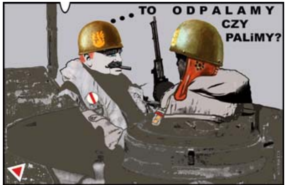
Rys. Wiesław B. Boltryk