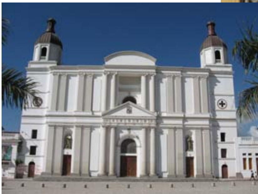
W Puerto Plata

ta, ktoś przewoził koguta i worki. W końcu po 4,5 godzinach jazdy (220 km) dotarliśmy do celu podróży.