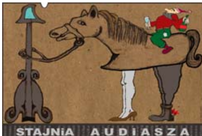
Rys. Wiesław B. Boltryk