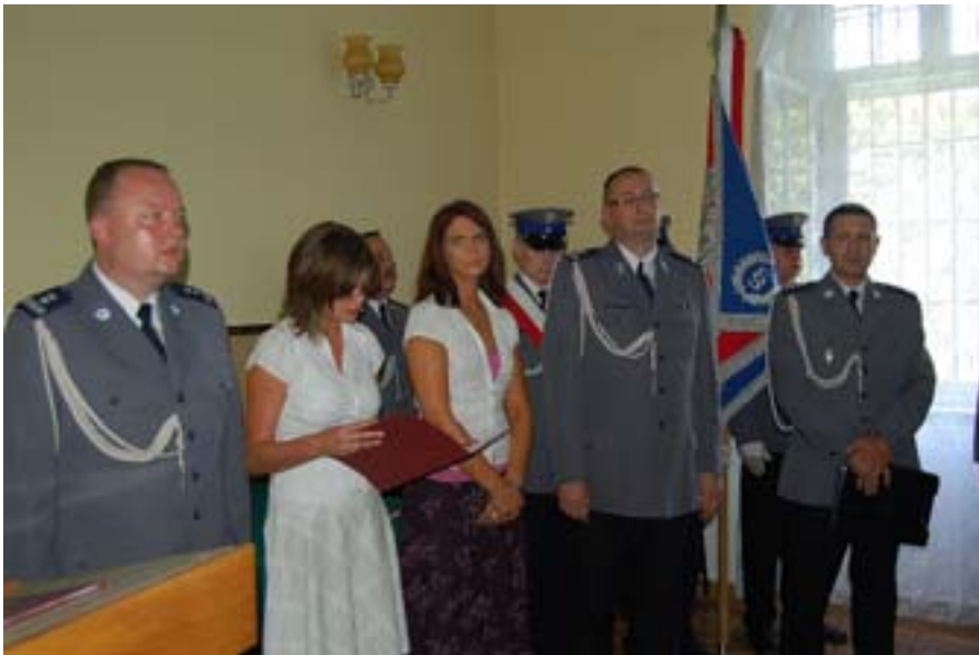
Pierwszy z lewej - przedstawiciel Komendy Wojewódzkiej Policji w Olsztynie.