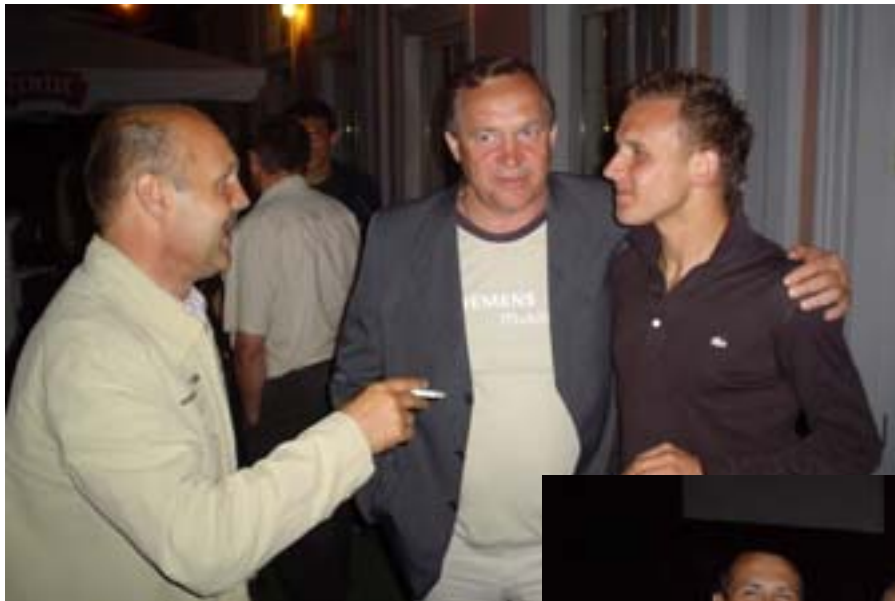
Rozmowy o piłce.