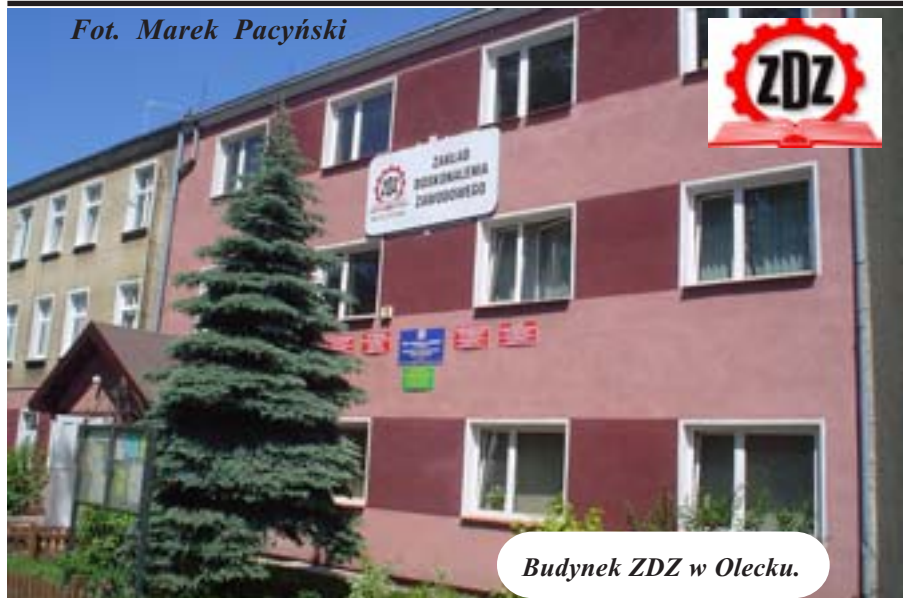
Budynek ZDZ w Olecku.