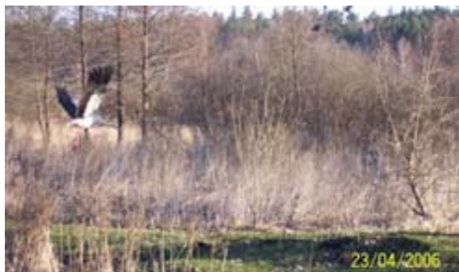
Już jesteśmy - bociany.