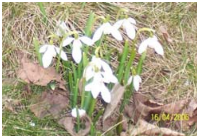
Kwiaty we włosy..