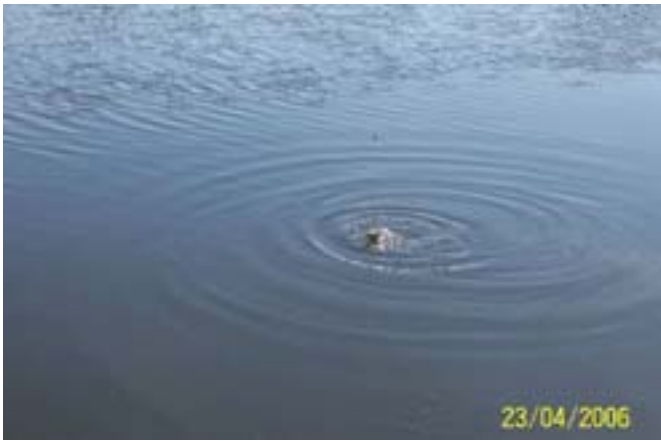
Ryba na holu.