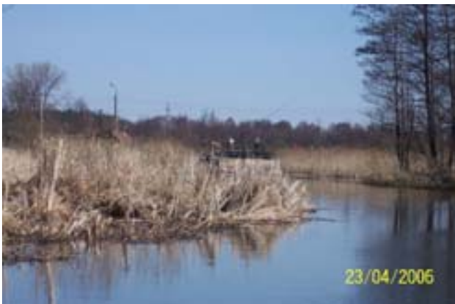
Łowimy rybki na Mazurce.