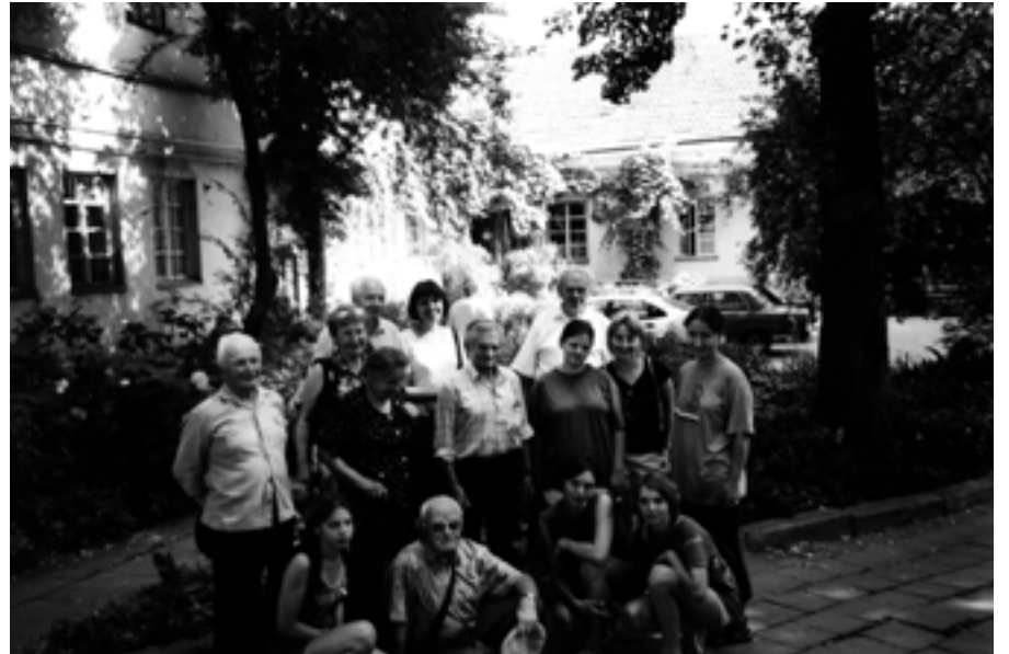
Złot 80-lecia CTW. Marny Widok od ul. Baszta.

Budynek ten został rozebrany, a obok zbudowano dwupiętrowy dom, w którym wg relacji naszego przewodnika mieściła się nasza izba. Przy tym budynku odśpiewaliśmy modlitwę harcerską, hymn harcerski i Marsylianę drużyny. Na tym zwiedzanie ulic, na których mieściły się nasze izby, zostało zakończone.