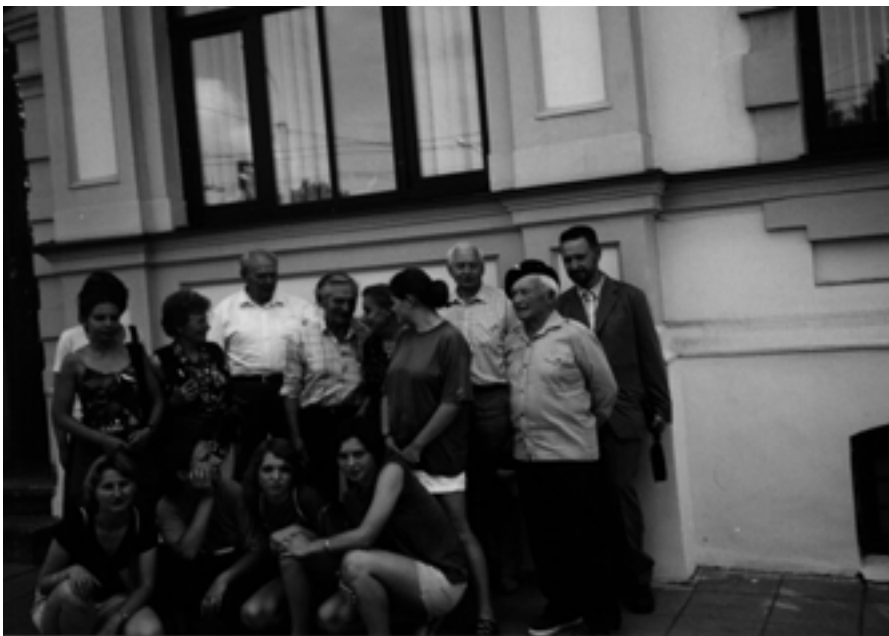
Przed „Marnym Widokiem”, ul. Pohulanka. Wilno, 15-18.08.2001r.

Z Wielkiej Pohulanki udaliśmy się do Katedry Wileńskiej, a po jej zwiedzeniu na Górę Zamkową. Ja, ze względu na niezbyt sprawne nogi, usiadłem w parku na ławce. Po pewnym czasie podeszła do mnie starsza kobieta i przemówiła po litewsku. Odpowiedziałem jej, że nie rozumiem. Przekonawszy się, że jestem Polakiem, opowiedziała o swo-