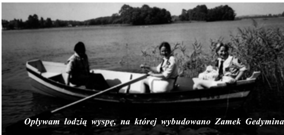
Opływam łodzią wyspę, na której wybudowano Zamek Gedymina.