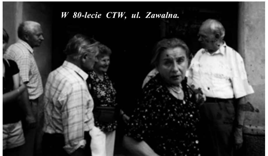
W 80-lecie CTW, ul. Zawalna.