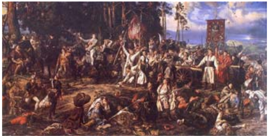
Bitwa pod Raclawicami (Jan Matejko).

go dzieła. Niezwykle, bo oglądający znajduje się w centrum wielkiej bitwy. Te dwa obrazy też kojarzą się nam z bitwą. Ale co wiemy o samej bitwie? Wydawać by się mogło, że bardzo dużo. Jednak czy ktoś pamięta tę datę, która jest wymieniona na początku? Ja przyznam się, że kojarzyłem sobie tylko kwiecień, a nie konkretny dzień.