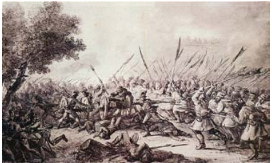
Bitwa pod Raclawicami - obraz Aleksandra Orłowskiego.