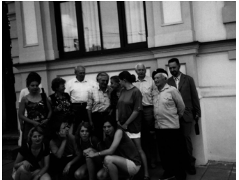
Dom, w którym rzekomo mieściła się izba zwana Marnym Widokiem przy Wielkiej Pohulance (w latach 1921-1933).