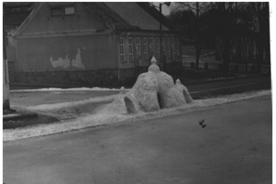
35-latka w całej okazałości. W grocie mieści się stolik ze śniegu, a wokół stolika ława śnieżna. Można przy nim usiąść i odpocząć lub wypić napój zamówiony w lodowej kawiarence.

a duże prawie idealnie! Odprawiwszy chłopców do domu, po jednorazowym polaniu i odnowieniu głównych linii rozpocząłem pokrywanie ich wodą, która momentalnie zamrażała. Po polaniu zaczął padać śnieg. Wyszedłem na zaśnieżoną tafle i kiedy dochodziłem do środka, nogi poszły do przodu, a ja przewróciłem się na plecy, uderzając głową w lód. Przez kilkanaście sekund leżałem na lodzie, następnie z trudem podniosłem się i stwierdziłem, że mam na głowie potężnego guza. Kiedy parę minut przez siódmą przyszło kilku chłopców, rozpoczęli oczyszczanie tafli ze śniegu. O ósmej już trwały na lodzie lekcje w-