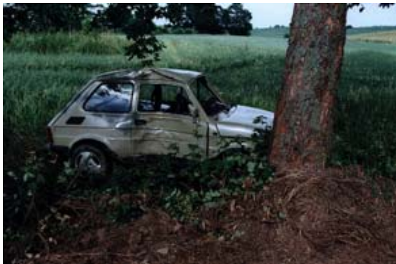
Przyczyna: Jazda z nadmierną prędkością..