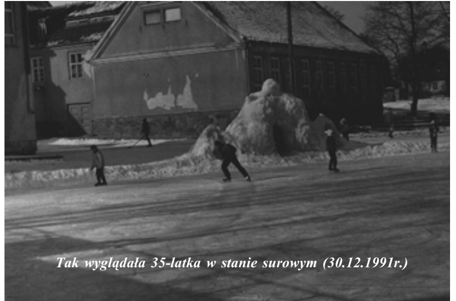
Tak wyglądała 35-latka w stanie surowym (30.12.1991r.)

Wieczorem 7 stycznia byłem tak wyczerpany, że zostawiłem kilku starszych chłopców, a sam poszedłem do domu, na ul. Składową, aby trochę odśpąnąć. Kiedy wróciłem o 1 w nocy, zastałem wszystkie lodowiska polane,