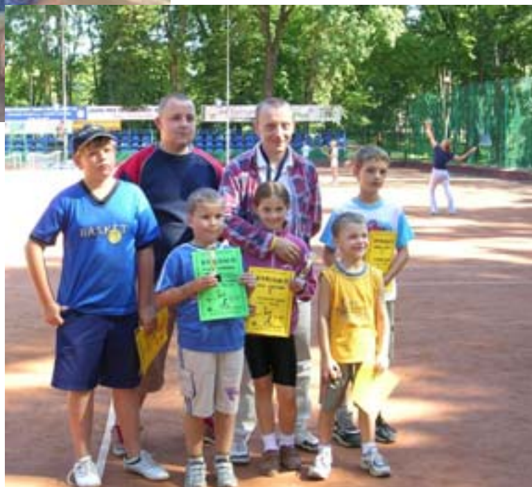
Mini tenis dzieci - zwycięzcy turnieju.