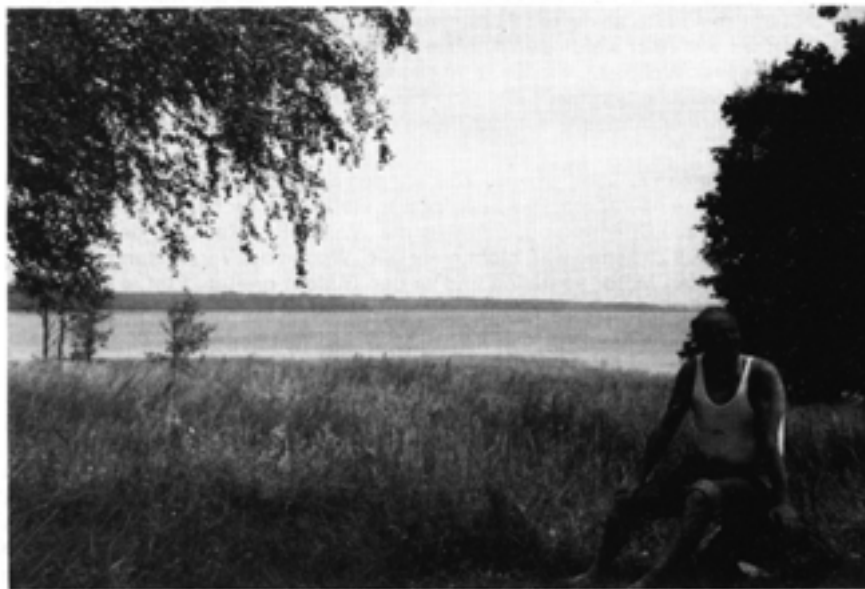
Auf der Trauminsel

Tym razem zastaliśmy wyspę całkowicie pustą, nie było żadnych ludzi ani zwierząt. Wysoka do kolan trawa i znaczenie większe teraz drzewa sprawiały wrażenie, pierwotnego, niezbadanego parku. Na wzgórzu wyspy drzewa odsłaniały widok na oddalone wody jeziora, gdzie na horyzoncie zalesiony brzeg zdawał się łączyć z niebem. Spomiędzy białych chmur cały czas wyłaniało się słońce i spowijało głęboki błękit jeziora połyskującą „suknią”. Białe chmury wydawały się mi tutaj jakby potężniejsze i wisiały na niebieskim niebie mocniej. Wzniosły widok. Miało to pewnie związek z ulotnością jezior mazurskich