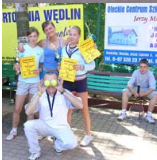
Najlepsze w kat. kobiet.