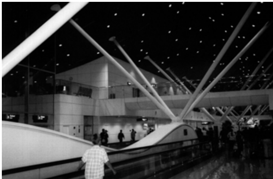
Malezja. Dworzec lotniczy w Kuala Lumpur.