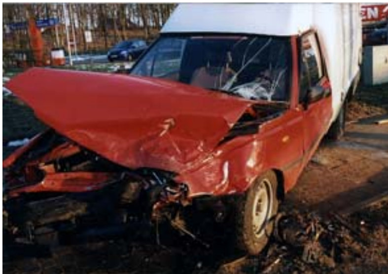
Przyczyna: wymuszenie pierwszeństwa przejazdu.

Zapraszamy do udziału w konkursie Tygodnika Oleckiego z okazji 400 wydania naszej gazety.