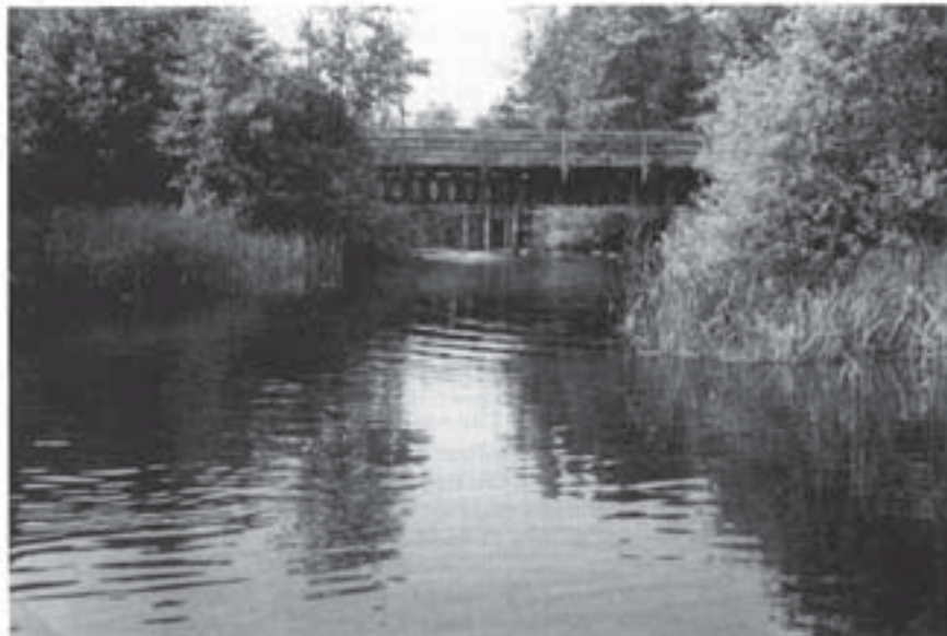
Zwischen Litigaino- und Haschner See