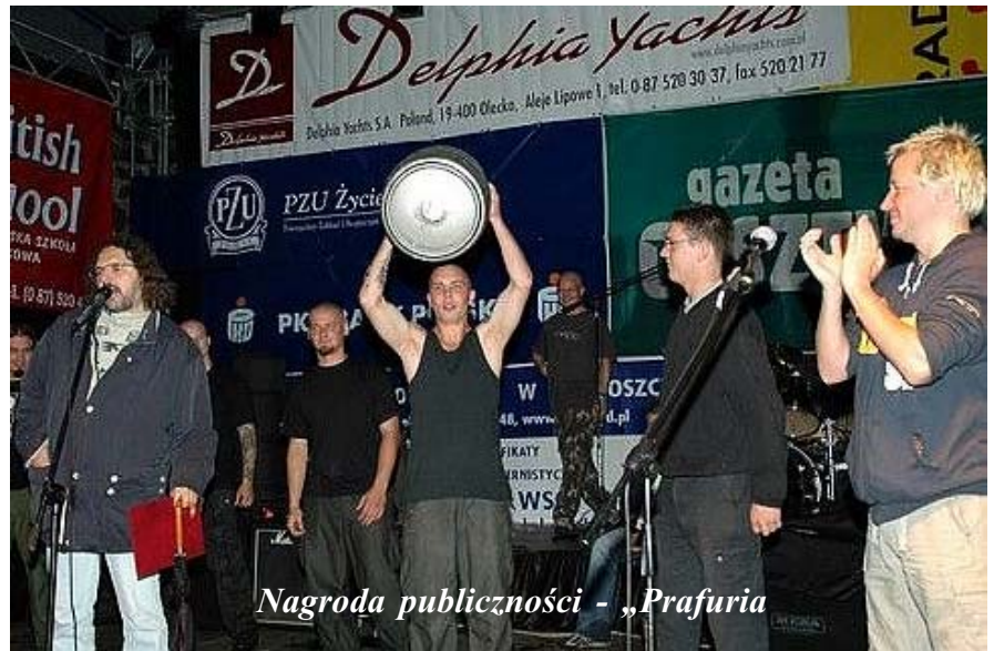
Nagroda publiczności - „Prafuria