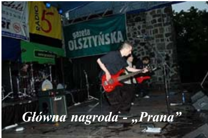
Główna nagroda - „Prana”