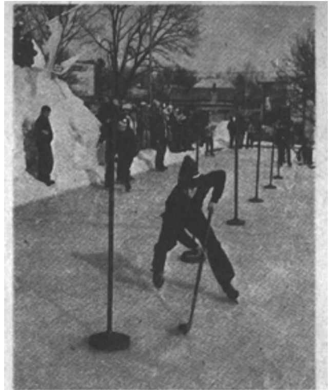
Na zdjęciu Złoty Krążek „Świata Młodych”, konkurencja slalomowa. Zdjęcie zostało wykonane na lodowisku „Bajka” w Olecku. Idealnie gładka tafa lodu i okalające ją rzeźby wzbudzają zachwyt nie tylko u tyżwiarzy

Postawiliśmy bandy z trzech stron, bo na czwartą, jak poprzednio, zabrakło desek. Dyrekcja szkoły obiecała posta-